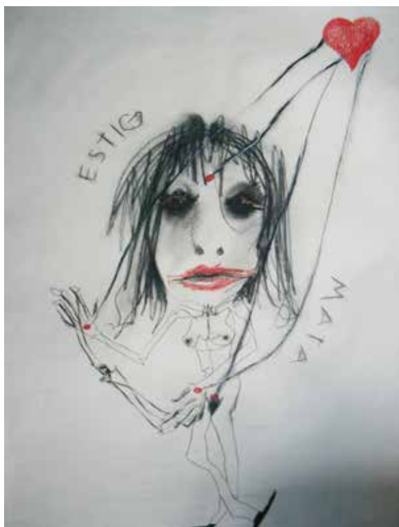
Estigmata (2008). Lápiz graso sobre papel: Layla Cora.

—como si al fin el tiempo coincidiese consigo mismo y yo con él, como si el tiempo y sus dos tiempos fuesen un solo tiempo