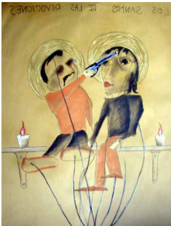
Los santos de las devociones (2008). Lápiz graso sobre papel: Layla Cora.

El sentido de extravío, pérdida, naufragio, “entretejidas vocales, consonantes: casa del mundo” (Paz, 1987: 14), de vivencias percibidas, extrañas y enemigas, producen y traducen experiencias de indecisión, incertidumbre, perplejidad, titubeo, duda, vacilación, confusión, ambigüedad, equivocidad, turbulencia, inquietud, intranquilidad, inestabilidad, desequilibrio... y configuran, dibujan estados de indefinibilidad algo más que los indescifrables estados de nostalgia, añoranza, deseo por lo ausente, dolor por la invisible presencia, pesar por la tangibilidad no palpable, por la sonora inaudibilidad, por la deletreable mudez de lo arrebatado, perdido, desgajado de la propia existencia. Y todo porque el problema no es ‘ser o no ser’, sino ‘ser aquello’ que todo hombre es: angostamiento, estrechez, sofocamiento... y no ser el que ‘se es’: siempre él mismo, pero nunca y siempre lo mismo. Ser morada y vivir a la intemperie, habitar en la claridad de un borrascoso, desteñido, huracán, brusco, arisco,