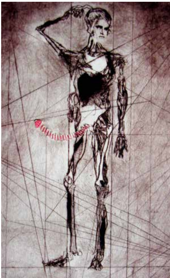
Ejercicio de descomposición (2005). Hucograbado sobre acrílico: Layla Cora.

El viento oye lo que dice el universo y nosotros oímos lo que dice el viento al mover los follajes submarinos del lenguaje y las vegetaciones secretas del subsuelo y el [subcielo: los sueños de las cosas el hombre los sueña, los sueños de los hombres el tiempo los piensa (Paz, 1987: 117-118).