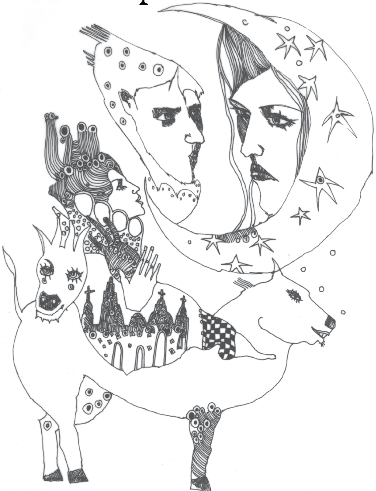
La mirada de la luna (2001). Tinta sobre papel: José Edgar Miranda-Ortiz.

LA COLUMNA 83 • julio-septiembre de 2014 • pp. 100-107 • ISSN 1405-6313