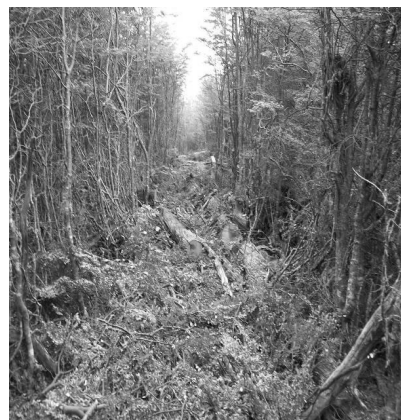
Figura 4. Aclareos mediante fajas de penetración. Figure 4. Spacing in strips of penetration.

As for spacing, no differences were observed in the number of remnant individuals respect the original mass, 50% for both cases. The difference lies in the remnant mass distribution (Figure 4 and 5). Neither are differences in total costs, as in thinning, hand labor has the highest percentage representing 75% of total costs. Operating laborers show significant differences for each treatment.