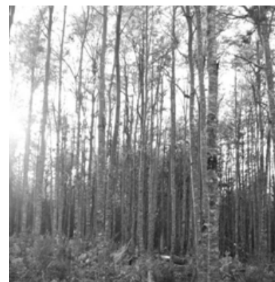
Figura 3. Aplicación de raleo por lo bajo. Figure 3. Crown thinning.

There were developed two application techniques; one by strips of penetration and the other by selective thinning. The first method involved the removal of all individuals in a strip with a north- south direction of 2 m wide, in a systematic and alternate way every 2 m (2 m removal x 2 m of forest without intervention). This eliminated 50% of the original mass, concentrating the remaining individuals in strips. It is expected a decreased competition for water, nutrients, and direct incidence of solar radiation on the remnant individuals so as ground.