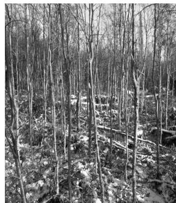
Figura 5. Aclareos selectivos. Figure 5. Selective spacing.