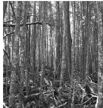
Figura 2. Raleo mediante liberación de copas. Figure 2. Application of low thinning.