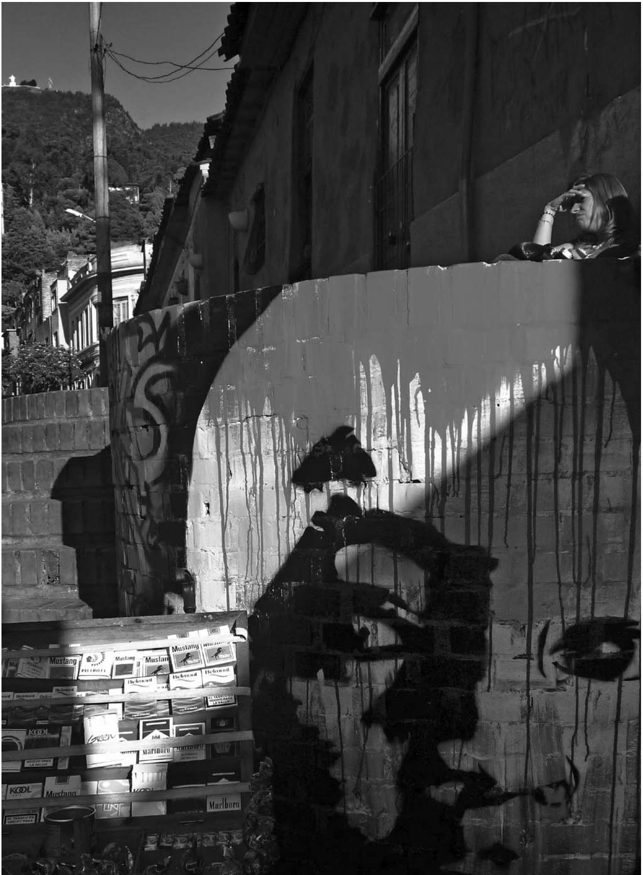
Escena urbana con grafiti. BOGOTÁ