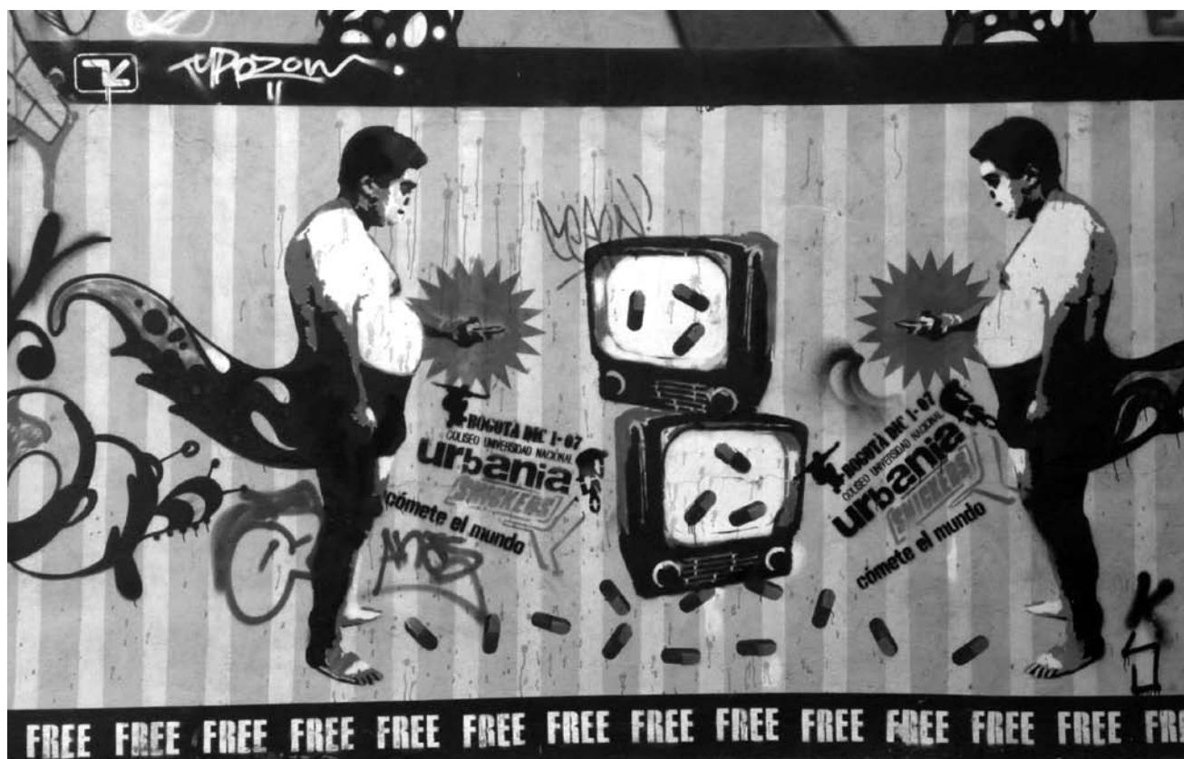
Graffiti. BOGOTÁ

diversas actuaciones y, desde allí, ofrecen un resguardo colectivo a las debilidades individuales, pero también una garantía frente a los riesgos a que nos expone la vida actual: el deterioro ambiental, la violencia generalizada, la marginación de sectores sociales cada vez más amplios. Entonces, cada quien se encuentra inmerso en una especie de movimiento estético que lo cobija, lo cual le permite conectar su producción con la de otros, en apariencia distantes 15 . Así, por ejemplo, en el esfuerzo por dar sentido a las palabras, irrumpe el reconocimiento de la importancia de la fuerza de la voz y de la capacidad para escuchar a otros. Dos aspectos otorgan vigor a la actuación de estos jóvenes: su sensibilidad ante las “pérdidas” de la vida contemporánea, en particular frente a las condiciones generalizadas de desigualdad, y su capacidad para deslizarse en escenarios globales complejos, ámbitos en donde se plantean esta clase de luchas. Todo ello se dispone en favor no sólo de la intensidad y la amplitud de la acción del colectivo, sino también de lo que cada uno constituye como elemento particular en su intento por conformar un estilo de vida propio 16 . Quizás lo que por momentos debilita este tipo de hermandad social espontánea, y en consecuencia la permanencia de los