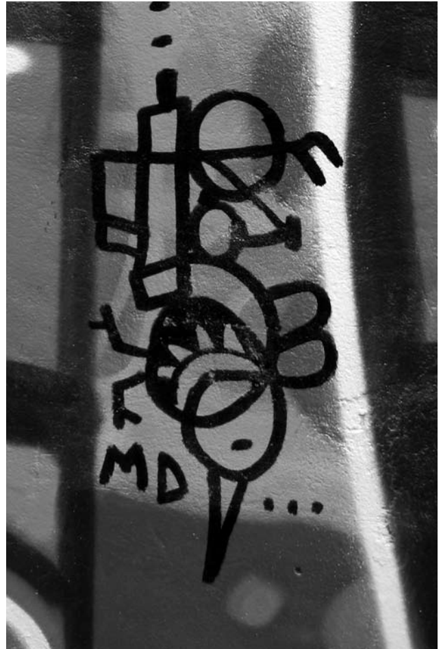
Grafiti. BOGOTÁ

Para quienes tienen como propósito educar a otros, adoptar la forma “escuela” es uno de los recursos al que acuden, pero introduciendo cambios significativos frente al modelo institucional. En primer lugar, no se presenta una clara diferenciación entre la función de “organizar”