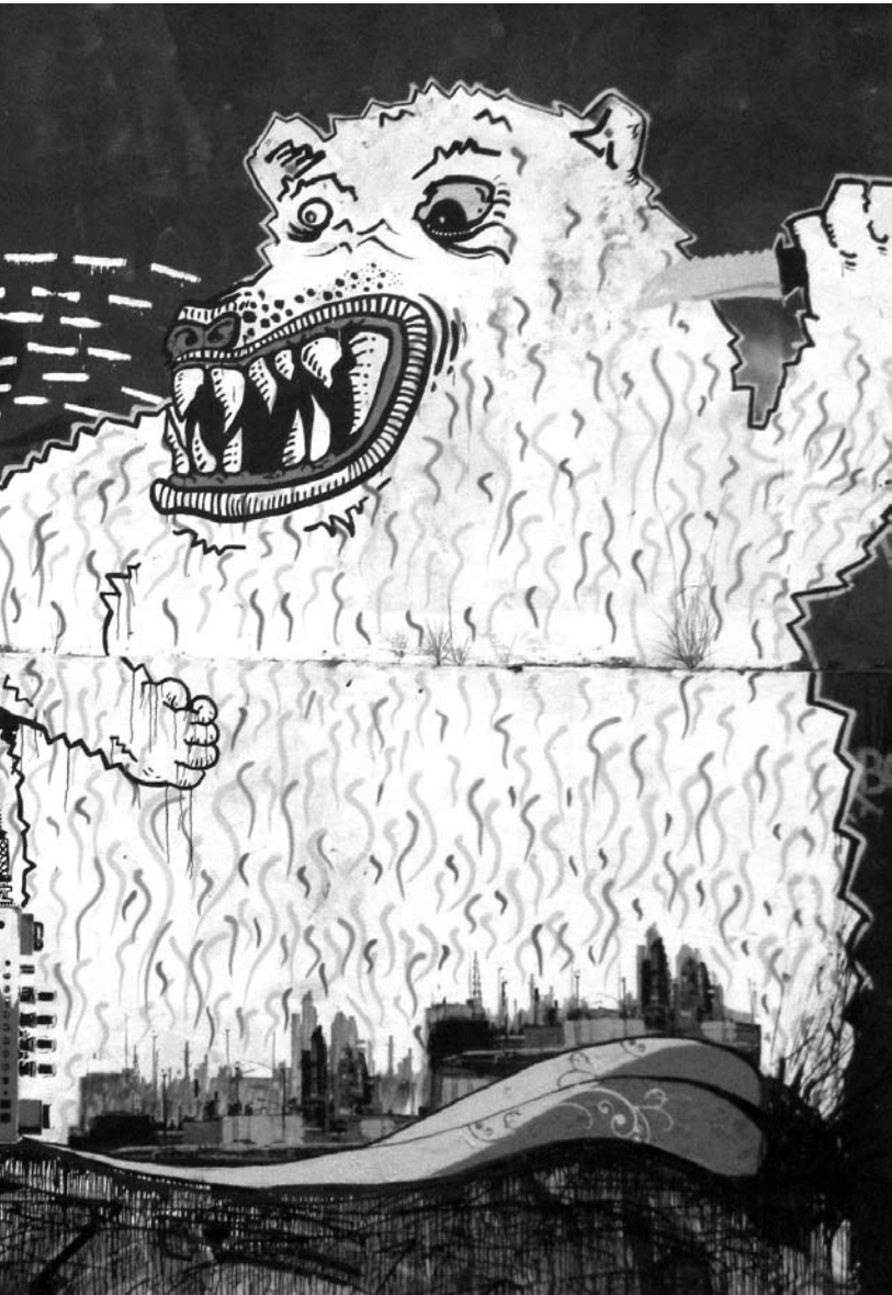
Grafiti. BOGOTÁ

19 Al respecto, es sugerente la interpretación de Roberto Esposito sobre Heidegger, a quien cita así: “[...] El Dasein resuelto puede convertirse en la ‘conciencia’ de los otros” (Heidegger cit. Esposito 2003: 162). Según este punto de vista, el único modo “político” o “ético” de relacionarse con los otros es abriéndose conjuntamente a la común responsabilidad por la propia cura; consiste en “reponer” al otro la posibilidad de ser-con en la donación, pues lo que acomuna no es un espacio lleno, sino un vacío, una carencia, una caída.