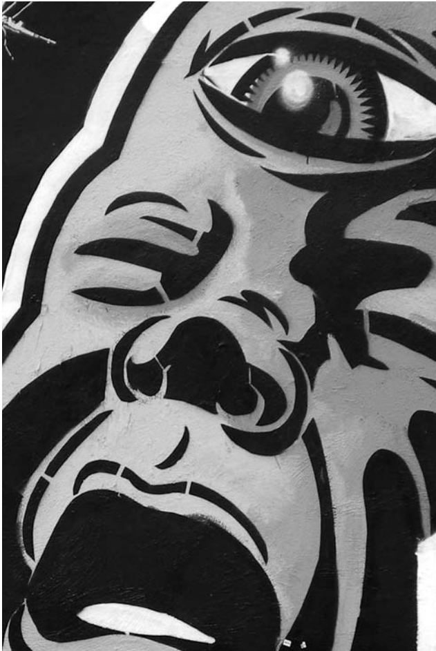
Grafiti. BOGOTÁ | FOTOGRAFÍA ARCHIVO DE EDITORIAL MAREMÁGNUM

rada de corto plazo, hay una especie de indiferenciación entre uno y otro tipo de agrupamiento, el hecho de reconocer los lazos de conexión entre distintos procesos (movimientos ambientalistas, de género, educativos, etc.) que resisten las políticas globales de incorporación jerarquizada al sistema, no implica para los colectivos diluir su especificidad y los intereses que impulsan su constitución. Incluso, algunas veces se producen modalidades de vinculación que poseen “menor densidad”, pues apuntan a actividades de colaboración o apoyo temporal, con miras a desarrollar las prácticas habituales más eficazmente, con mayor amplitud, o simplemente para contribuir a emprendimientos concretos de otros colectivos.