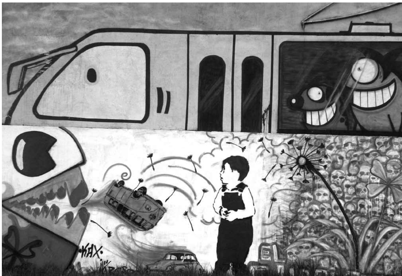
Detalle de grafiti de varios autores y técnicas. BOGOTÁ

asumidas con la participación individual de sus integrantes. Cuando por diversas circunstancias las agrupaciones insisten en alcanzar determinados objetivos y dirigir las prácticas a escenarios preestablecidos (tales como lograr cierto tipo de organización política, producir un recurso institucional, prestar determinada clase de servicios o bienes, etc.) sin que la fuerza que moviliza las relaciones internas lleve a sus integrantes a visualizar otras conexiones con otros, entonces el impulso colectivo se debilita, la acción se torna rutinaria y el grupo tiende a fragmentarse o dispersarse, a pesar de que sirve como refugio ante la inseguridad y precariedad de la ciudad contemporánea. Tal circunstancia limita la posibilidad de enfrentar los problemas sociales que afectan a cada quien y, sobre todo, dificulta constituirse en ámbito de resistencia frente a las condiciones que producen la desigualdad. No obstante, ello no impide que se presenten experiencias y prácticas que se apartan de dichos fines, precisamente porque la acción convoca, de modo inusitado, la sensibilidad, la experticia y la fuerza individuales, prestándole un apoyo adicional.