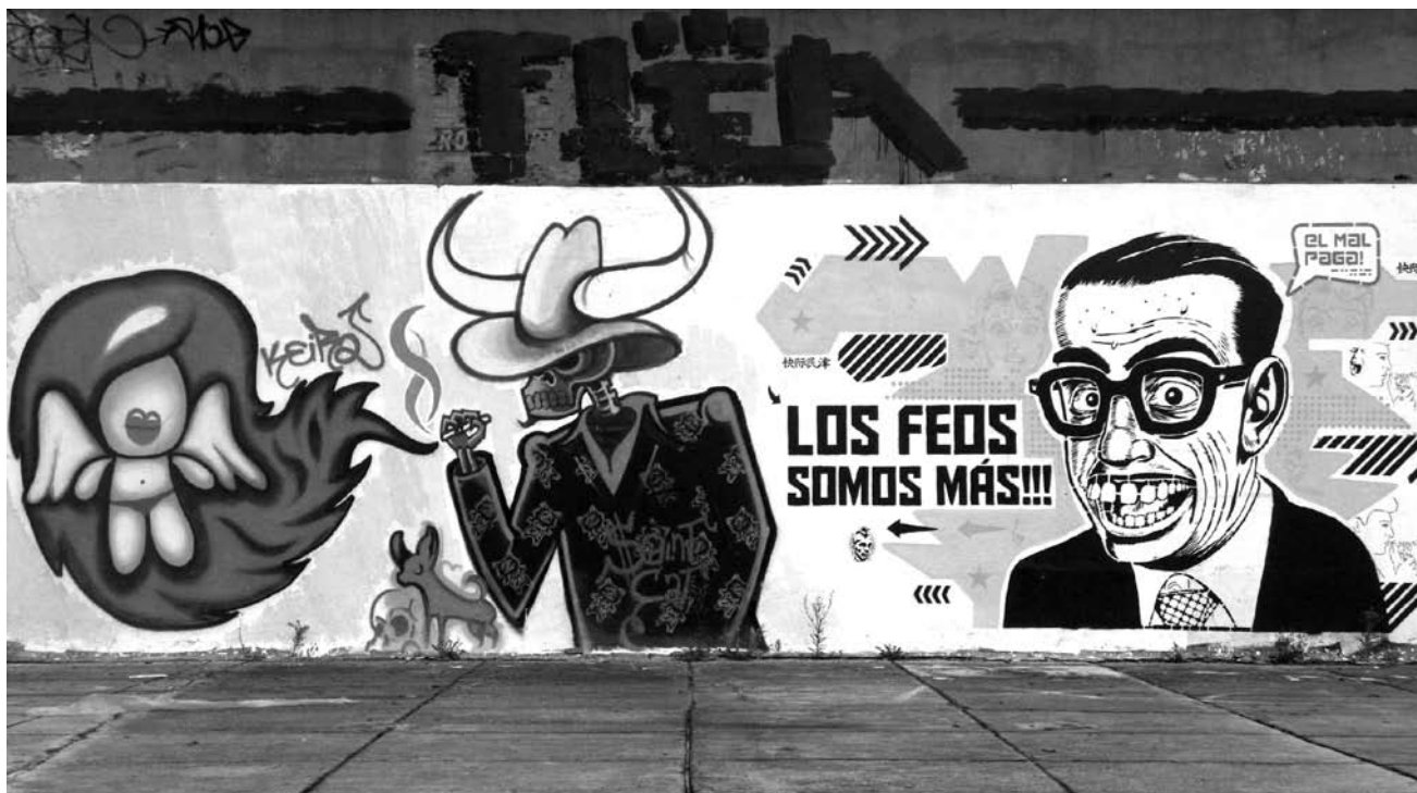
Detalle de grafiti de varios autores y técnicas. BOGOTÁ

maltrato, la violencia intrafamiliar, el deterioro ambiental, el consumismo, etc.); mediante el cultivo de la destreza física como entrada a lo que significa la formación integral de la persona; ejerciendo la condición de ser “ilustrados” de excepción con el propósito de impulsar a otros para que desplieguen sus particulares aptitudes; por último, al adoptar un estilo de vida singular, ajustando constantemente el nexo entre sus formas de pensar y de actuar.