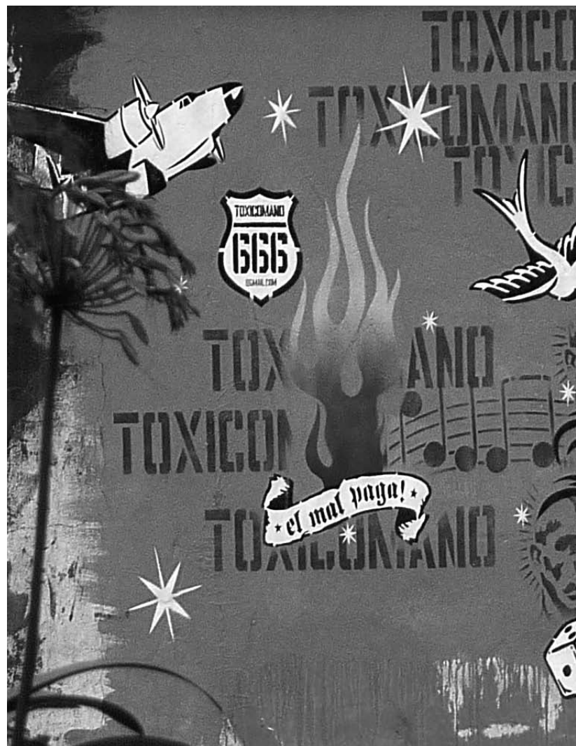
Graffiti. BOGOTÁ

Por su parte, los colectivos ecológicos operan principalmente mediante un contagio directo, afectivo, corporal y reflexivo, buscando asociar a otros a su causa, mediante acciones realizadas en espacios delimitados de la ciudad (el circo, la plaza de toros, los humedales, las fuentes de agua) sin, necesariamente, integrarlos a la organización; pero en razón de que formulan preocupaciones globales, alcanzan a afectar a otros sectores de la población y en lugares distantes. Así mismo, con su capacidad para fluir