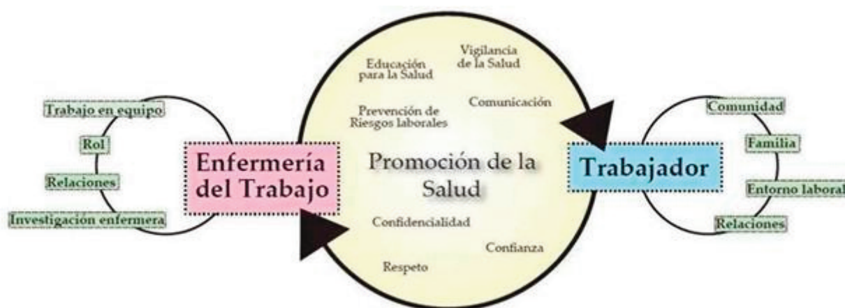
Figura 2. Modelo de Promoción de la Salud en el Trabajo de Sánchez-López (2016)