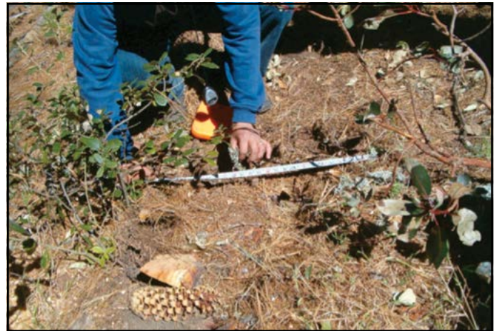
Figura 3. Establecimiento de un sitio de muestreo.

Para el cálculo de la densidad aparente se usó el método del cilindro de volumen conocido (Forsythe, 1975). Las muestras fueron colocadas en una bolsa de papel con la identificación del sitio y la profundidad de extracción de la muestra. El secado de las muestras se hizo en estufa a 100 °C durante 72 h; ya secas, las muestras se pesaron en una balanza analítica para determinar su peso seco con el fin de determinar la densidad aparente del suelo mediante la siguiente relación: