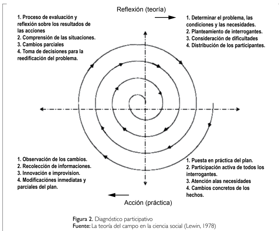
Tabla 3. Variables seleccionadas por los participantes