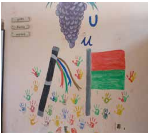
Figura 4. Iconografía en educación propia. Resguardo Cerro Tijeras.

En este marco se ubica la iconografía propia, como la construcción simbólica de los héroes, de la historia, de los referentes identitarios de la constitución de la cultura indígena como expresión del discurso pedagógico que apoya la construcción del Sistema Educativo Indígena Propio. (Ver Figura 4).