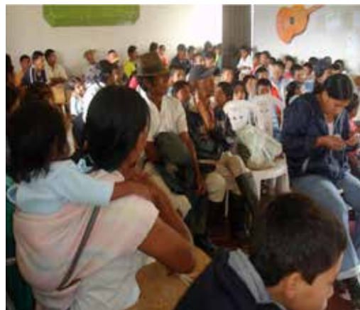
Figura 2. Asamblea Comunitaria. Cabildo de Pueblo Nuevo, Ceral.

decisión “las Asambleas Comunitarias” como espacios de deliberación colectiva. (Ver Figura 2)