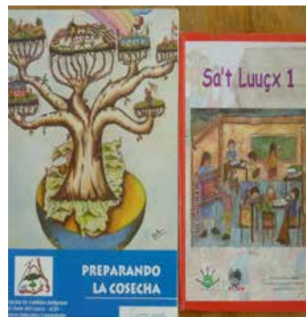
Figura 1. Material didáctico del Proyecto Educativo Comunitario (PEC).

Durante los años noventa se impulsa la construcción de los Proyectos Educativos Comunitarios (PECs) 13 , se elaboraron materiales educativos bilingües (Ver Figura 1.) impulsando la promoción de experiencias educativas a partir de centros experimentales comunitarios de educación bilingüe (CE-CIBS), se diseñan las áreas del currículo propio y se impulsa, con mayor vigor, la investigación y la capacitación de maestros indígenas (CRIC, 2004).