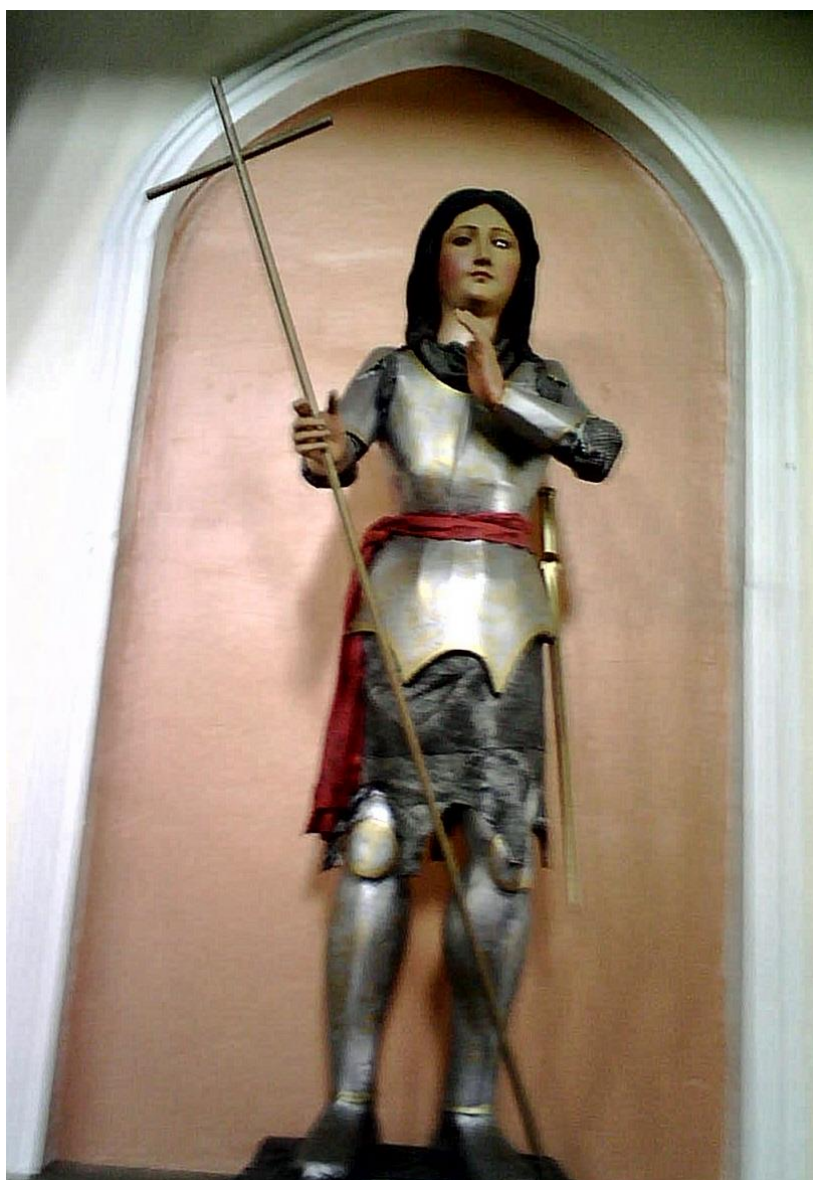
Imagen de Santa Juana de Arco ubicada en la Capilla del Ministerio de Seguridad Pública en San José