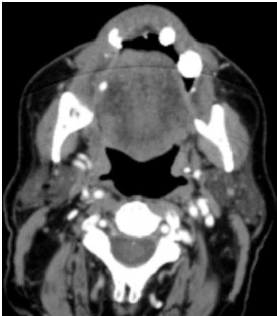
Figura 3. Corte axial de TC donde se observa la duplicidad de la vena yugular interna izquierda.