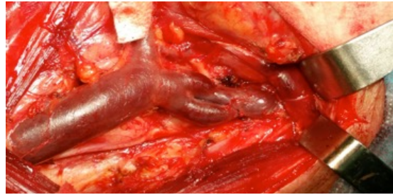
Figura 1. Vaciamento cervical funcional ganglionar izquierdo. Duplicidad parcial de la vena yugular interna izquierda en el tercio superior y el cruce del nervio espinal lateral a la fenestración.

Varón de 76 años de edad con antecedentes de bronquitis crónica y enfisema e intervenido de carcinoma de tráquea en 2010 a quien le fue realizada traqueotomía y exéresis del segundo y tercer anillo traqueales en bloque con el tumor. Posteriormente fue tratado con radioterapia adyuvante. A los cinco años presentó un segundo tumor localizado en hemilaringe izquierda (estadio III; T3N0M0). Se realizó laringectomía total y vaciamiento cervical funcional ganglionar izquierdo y fistuloplastia fonatoria primaria. En la cirugía se observó duplicidad parcial de la vena yugular interna izquierda en el tercio superior no informada en la tomografía computarizada (TC) (Figura 1). Durante el postoperatorio el paciente presentó fistula faringocutánea y se colocó un tubo de derivación salival de Montgomery. A los pocos días, tras la retirada del tubo, fue dado el alta sin fistula salival.