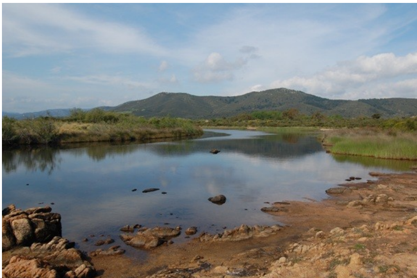
Fig. 3. Habitat di Canthydrus diophthalmus (Reiche & Saulcy, 1855): Comune di Villaputzu, frazione di Quirra, Stagno di Murtas.

L'interessante ritrovamento, amplia le conoscenze sulla distribuzione nell'isola di un'interessante specie, conosciuta sinora della sola Sardegna sud occidentale. Non si esclude la concomitante presenza anche in altre aree umide della Sardegna, specialmente in quelle della provincia di Oristano (Sardegna centro-occidentale), che presentano ambienti di transizione di particolare bellezza e che, secondo una sommaria analisi, sembrerebbero essere adatti ad ospitare la specie.