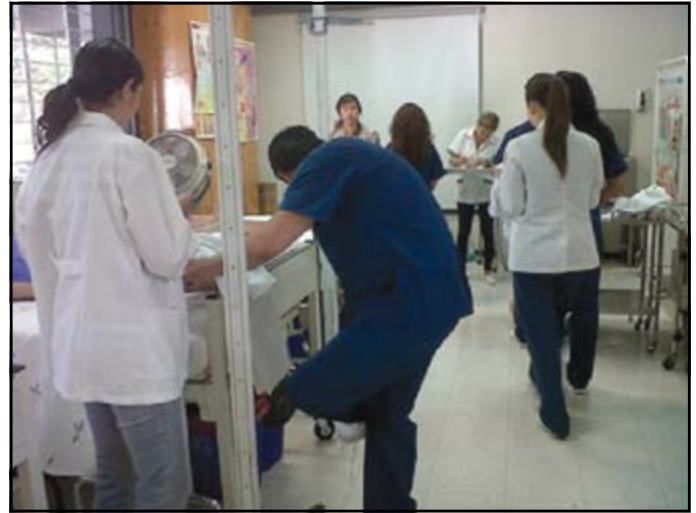
Figura 1. Toma de mediciones antropométricas.

Los hombres presentaron un peso mayor en comparación con las mujeres, así como las licenciaturas de medicina y terapia física tienen los pesos más elevados y la licenciatura en nutrición presenta el promedio de peso más bajo. Las licenciaturas que presentaron mayor CC fueron las de estomatología y medicina, mientras que la licenciatura en nutrición presentó las mediciones más bajas (Tabla 2).