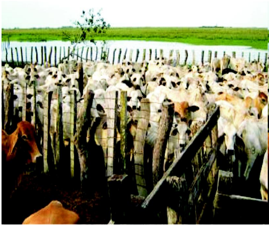
Figura 2. Suplementación con BME en ganadería de cría.