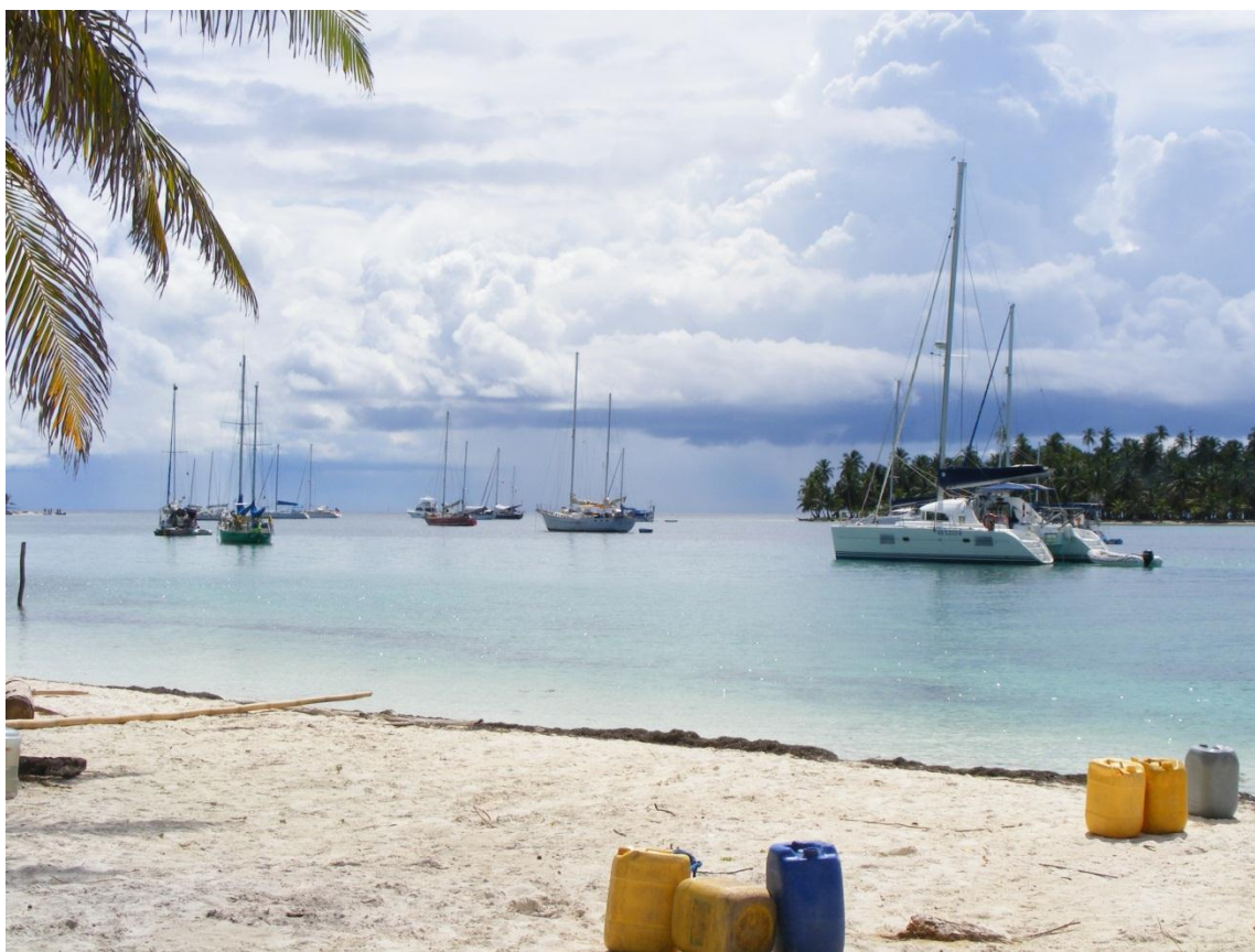
Figura 3 Veleros en Chichimé, comarca de Gunayala

Cartagena, sólo viajan de Miramar o Gardi a Sapsurro (primer pueblo después de la frontera). Los veleros tienen una capacidad variable. Los hay que admiten dos mochileros y los hay que en el mismo espacio pueden llevar a 6 personas. Tanto en la ciudad de Panamá como en Cartagena hay una red conformada por capitanes de barcos y hostales que gestionan la travesía de los mochileros. Por Internet también es posible establecer contactos con algunos de los capitanes.