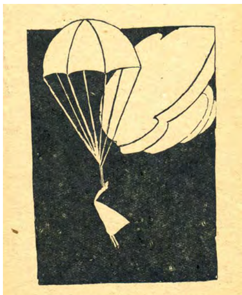
Ilustración de Guillermo Castillo (seud. Cas ) de la 1. a ed. de La Señorita Etcétera (1922).

no pocos aspectos en común 15 . Quizás uno de los puntos centrales de aproximación entre estas dos novelas sea la tensión entre la modernidad y la tradición, la modernidad y la nostalgia. En el caso de Gómez de la Serna, no es que la fe en la novedad se fuera diluyendo a favor del escepticismo de una utopía artístico-literaria que no pudo consagrarse por múltiples razones (el contexto histórico, el exilio ramoniano, la conciencia de la dificultad desarrollada por el propio autor o la misma esencia de la literatura y el arte). Pues Ramón, aunque desde un primer momento abrazó enérgicamente los nuevos postulados —y su praxis, sus reflexiones y su vida así lo