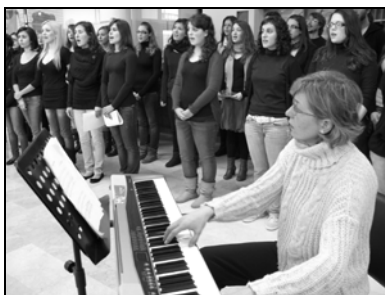
Conciertos realizados en diversos espacios del campus de la UIB, 2011.

En el nuevo marco del Espacio Europeo de Educación Superior, los estudios de maestro han visto cómo sus planes de estudio y el formato de las especialidades ha cambiado de manera sustancial. A partir de la LOGSE, de 1990, se creó la especialidad del maestro especialista en educación musical. Ello comportó un salto cualitativo importante en cuanto al reconocimiento explícito de la importancia de la música en la escuela, ya que la creación de dicha figura se complementó con un currículum de primaria mucho más desarrollado y secuenciado. Dicho marco legal contemplaba además las especialidades en educación infantil, educación primaria, educación física, educación especial, audición y lenguaje y