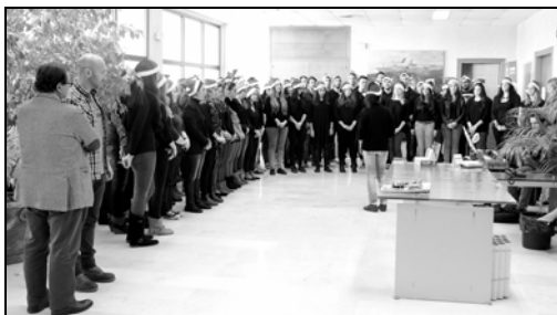
Conciertos realizados en diversos espacios del campus de la UIB, 2015.