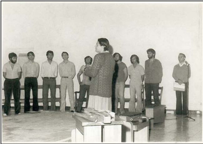
Alumna de magisterio dirigiendo. Iglesia de Sant Dídac, Alaior (Menorca), 1979

de islas del archipiélago balear: Menorca, Ibiza y Formentera. El objetivo de la creación de esta agrupación coral era el de hacer más conscientes a los futuros maestros de la vivencia musical en toda su amplitud, y de la importancia del canto e interpretación colectivas, aportándoles experiencias musicales que les permitieran disfrutar y vivir en primera persona lo que debían ser capaces de transmitir a sus futuros alumnos. Del mismo modo pretendía que los futuros maestros descubrieran las potencialidades de dicha práctica más allá de los aspectos estrictamente musicales.