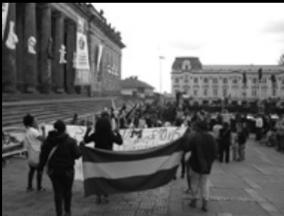
Mobilización de mujeres negras por el cuidado de la vida y los territorios ancestrales. 2014