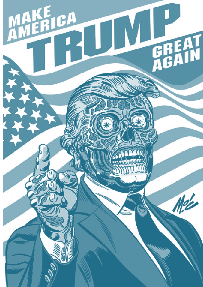
Ilustración de Mitch O'Connell

Pudiésemos decir que se nos presenta como una ruptura con la mirada androcéntrica y antropocéntrica dominante del desarro-