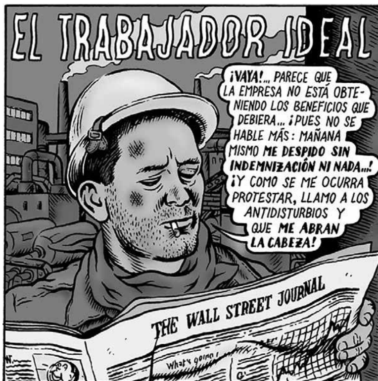
Ilustración de Miguel Brieva | Revista Dinero

La crisis que vivió el capitalismo en la década de los setenta del siglo anterior, no sólo tenía que ver con la entrada de un nuevo sector hegemónico en su proyecto de control y poder. El capital financiero, el cual desplazaba al manufacturero, ante las dificultades de pago de los préstamos realizados a muchas de las economías emergentes, generó una crisis en el proyecto, donde un lugar muy visible lo tuvo la deuda externa.