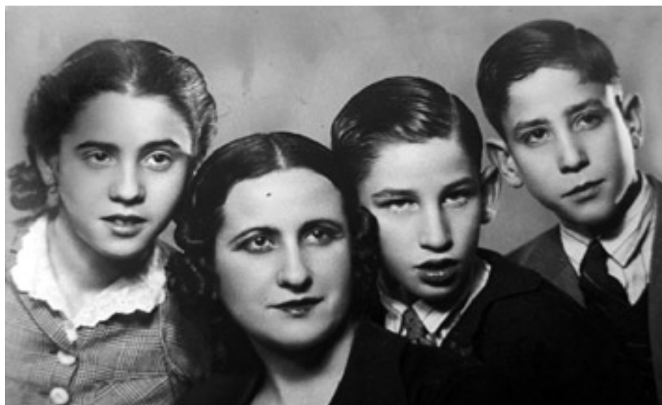
Fig. 4. Foto de estudio realizada en Barcelona en 1943 3

El estallido de la Guerra Civil en 1936 y el riesgo que suponían los bombardeos aéreos sobre la ciudad, aconsejó el traslado de los niños (M a Rosa, Néstor y Sergio) a Calders, el pueblo de los abuelos maternos. A finales de enero de 1939, Herminio Almendros forma parte del éxodo de casi quinientas mil de personas que cruzan la frontera. Su mujer y sus hijos quedan atrás.