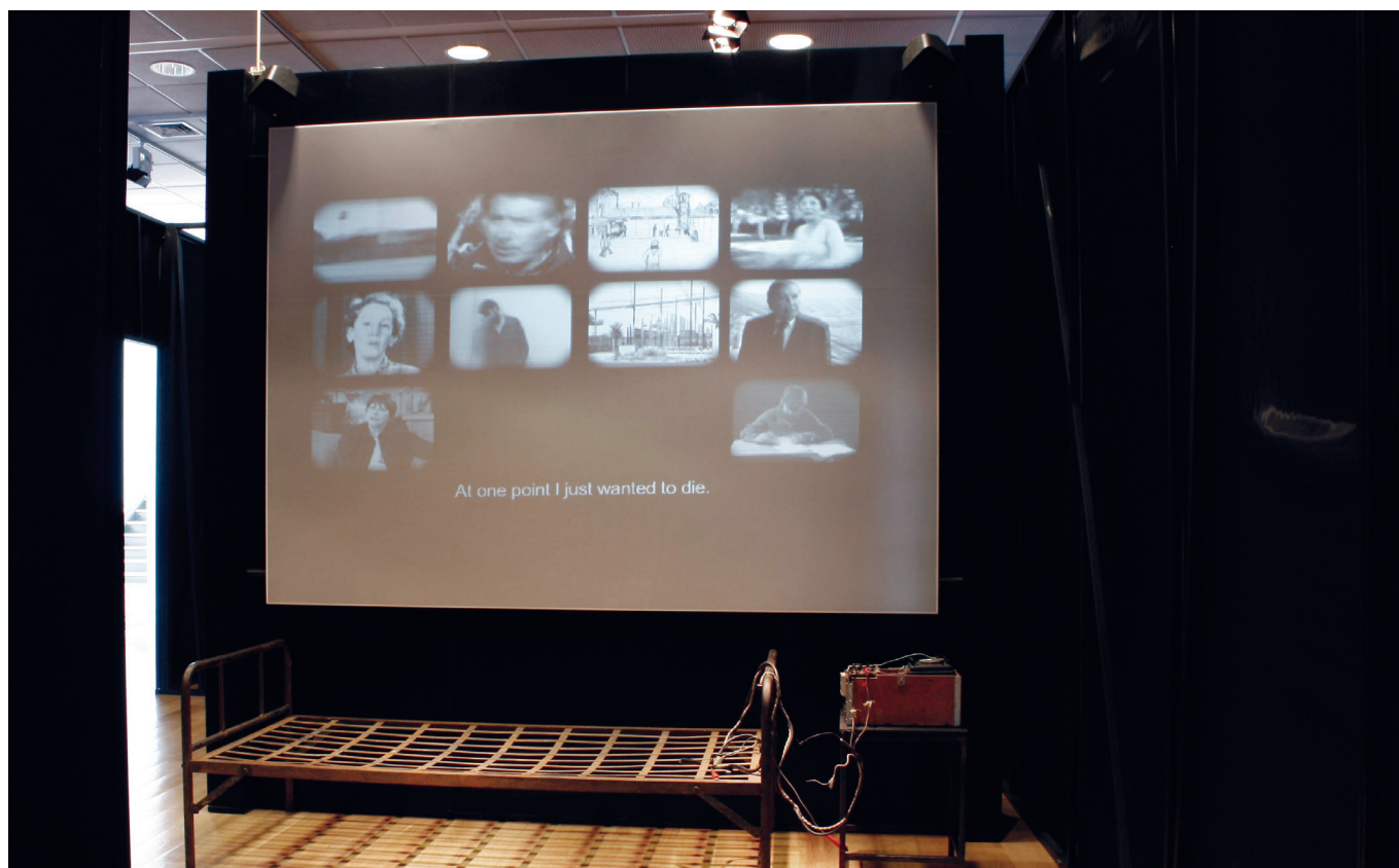
FIGURA 5. Detalle de la sección Represión y tortura.

A este espacio lo separa del resto del museo una tela en la que están impresos los nombres de los ejecutados y desaparecidos. Ahí se presenta un catre junto a un aparato de descargas eléctricas bajo un telón en el que se proyectan testimonios de personas torturadas; al frente, dibujos y pequeños fragmentos descriptivos de las técnicas de tortura utilizadas por los militares, incluidos: la aplicación de corriente eléctrica; golpizas reiteradas; lesiones corporales deliberadas; colgamientos; posiciones forzadas; privación o interrupción del sueño; asfixias y exposición a temperaturas extremas; amenazas; simulacro de fusilamiento; humillaciones y vejámenes; desnudamiento; agresiones y violencia sexuales; presenciar torturas de otros; ruleta rusa; confinamiento; métodos de fusilamiento; desaparición de personas. La museografía también presenta libros que recopilan documentos con información minuciosa sobre casos emblemáticos, como La caravana de la muerte , Montajes de prensa , Sobrevi-