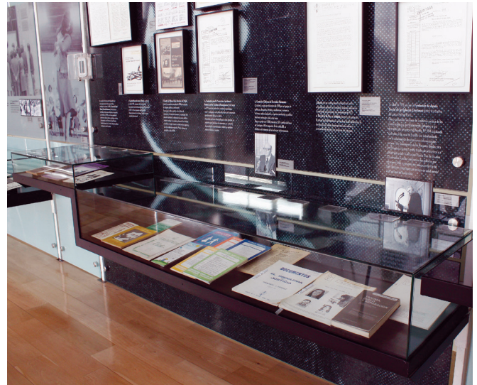
FIGURA 3. Detalle de la sección Condena internacional. La dictadura traspasa las fronteras (cortesía: Museo de la Memoria y los Derechos Humanos, 2010).

En mi opinión, una representación metafórica, estética, sensible, meditativa y no figurativa del horror puede abrir posibilidades de interpretación, reformular y modificar el referente, hacer uso de códigos, formas y conceptos que desbordan la racionalidad y la mimesis —lo cual no significa que se trate de representaciones desinformadas y acríticas—, tiene el riesgo de caer en lecturas ininteligibles, intrincadas que incurran en un mensaje que sólo el erudi-