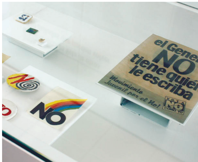
FIGURA 2. Detalle de la sección Plebiscito.

sanía carcelaria, artesanías elaboradas en otros contextos y objetos históricos (predominan, por su cantidad, la artesanía carcelaria y, enseguida, los objetos históricos) (Equipo Colecciones 2008:7) (Figura 2).