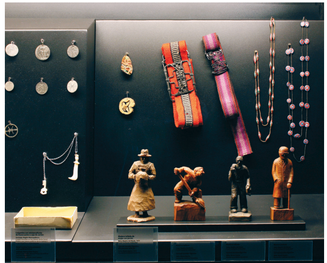
FIGURA 4. Detalle de la sección Artesanía carcelaria (cortesía: Museo de la Memoria y los Derechos Humanos, 2010).

to sea capaz de descifrar, o bien en una hiperesteticidad donde el exceso de plástico y fantasía provoque distanciamiento e insensibilidad, una tergiversación del acontecimiento que no evoca ni exige al visitante una toma de postura crítica. Para evitar lo anterior, es recomendable una mediación a través de la entrega de: