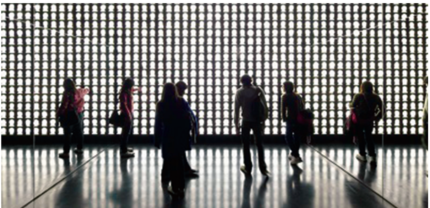
FIGURA 6. Geometría de la conciencia Cristóbal Palma, Estudio Palma (cortesía: Museo de la Memoria y los Derechos Humanos, 2010).