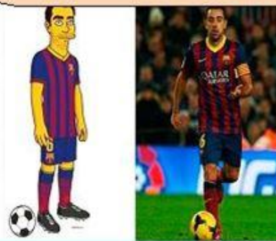
Xavi Hernández, jugador de fútbol.