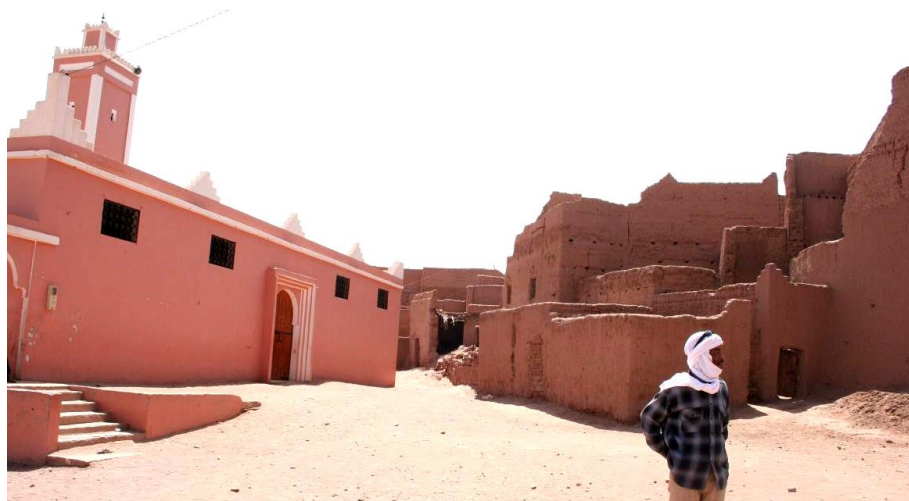
Fig. 7. Mezquita nueva de M'hamid el Gbezlane.

Esta nueva forma de construir lleva asociado un malentendido concepto de progreso social, por lo que las familias que logran reunir unos pequeños ahorros se construyen una nueva vivienda de bloque de hormigón, si bien muchos de ellos continúan viviendo en las antiguas construcciones de tierra, que resultan más confortables aunque requieran de un mantenimiento que el bloque no precisa.