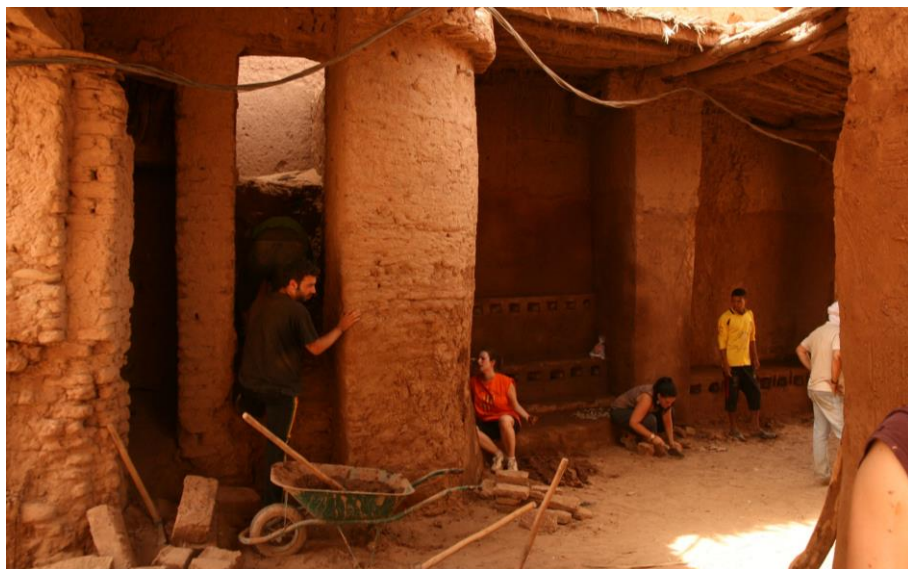
Fig. 8. Restauración de la Puerta de Mhamid el Ghezlane.

Nuestra forma de trabajar pasa por la implicación de la población local, sin la cual, nada de esto tendría sentido. Durante los talleres, tanto el personal contratado por Terrachidia como los voluntarios y los participantes, trabajan de forma conjunta. Cuando termina el taller, los habitantes adquieren la responsabilidad de terminar el trabajo iniciado. En los talleres posteriores se hace la evaluación de las obras realizadas, apoyando que ellos mismos puedan seguir manteniendo lo ejecutado e identificar nuevas necesidades por las que trabajar.