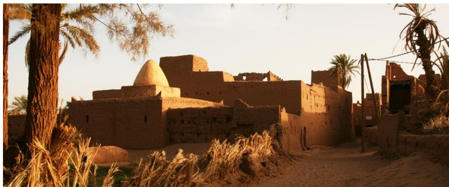
Fig. 1. Poblado de Bounou.

ha invertido en mejorar las comunicaciones y las infraestructuras pero solo en niveles básicos.