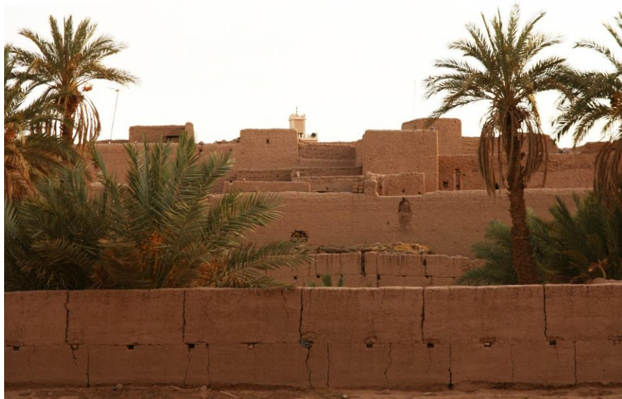
Fig. 2. Poblado de M'hamid.

Los poblados tienen sus equipamientos en estados de conservación muy diferentes: la mezquita, la escuela, los pozos, las puertas, los morabitos, etc. Algunos poblados aún conservan sus antiguas mezquitas, de varios siglos de antigüedad. Otros, sin embargo, las han abandonado y han construido otras nuevas con bloque de hormigón armado, y cuya calidad constructiva y confort térmico son mínimos.