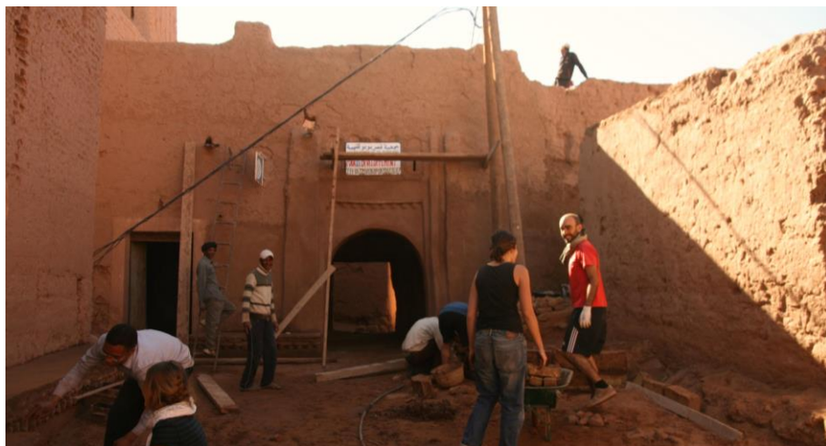
Fig. 9. Restauración de la Puerta de Bounou.