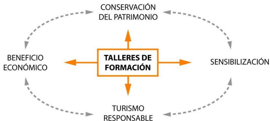
Fig. 10. Metodología de Terrachidia.

Creemos, sin embargo, que este proceso todavía es reversible en el Oasis de M'Hamid, consolidando una inercia de colaboración en la que ambas partes se sienten beneficiadas y aprendan del trabajo conjunto. Se propicia un intercambio de intereses evitando una visión paternalista de la colaboración.