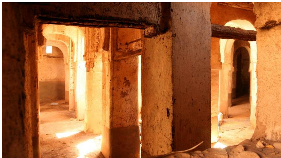
Fig. 3. Mezquita de M'hamid el Ghezlane.

Otros edificios significativos que encontramos en el paisaje son los morabitos, construcciones vinculadas a las tumbas de santones o marabús, personas elegidas por Dios para mediar entre él y la población y que han tenido una gran importancia en los últimos siglos. Son construcciones pequeñas, vinculadas a un cementerio y generalmente de planta cuadrada y con cúpula. También encontramos pozos, cercados, etc.