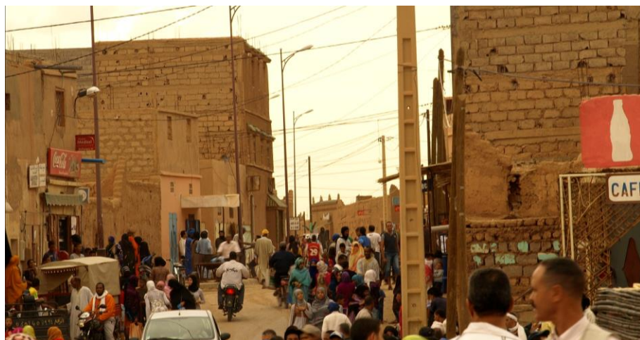
Fig. 6. Escena urbana de M'hamid Nuevo.

Los nuevos crecimientos de las ciudades, enteramente contruidos de bloque, generan un paisaje desolador, donde la trama urbana es copia de la europea, con grandes avenidas que carecen de espacios en sombra (imprescindibles en este clima) y donde el espacio público se hace invivible.