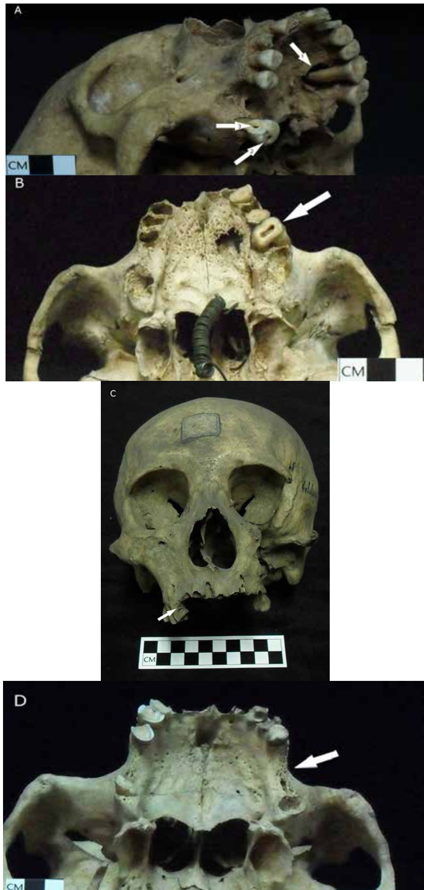
Figura 3A. Condiciones patológicas y de adecuación fisiológica de la dentición. A) Absceso lingual (flecha 1) y caries oclusal (flecha 2) e interproximal (flecha 3). B) Desgaste, C) Periodontitis, D) Pérdida dental antemortem.