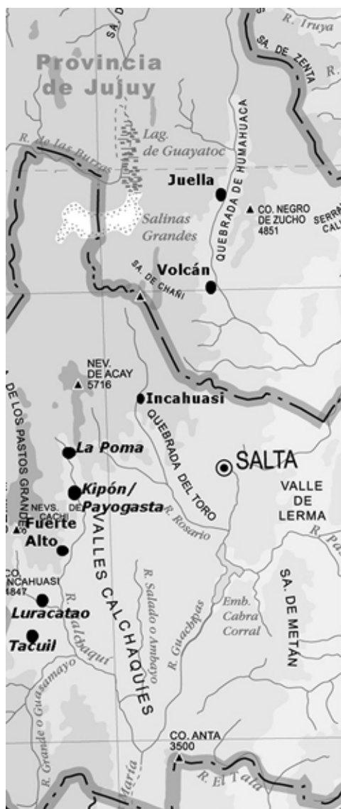
Figura 1. Sitios arqueológicos mencionados en el texto. Los nombres que figuran en cursiva corresponden al nivel de procedencia localidad.

entender las experiencias que afectan a la biología humana en el marco de relaciones de poder que estructuran el acceso a los recursos materiales y, de esta forma, “desnaturalizar” la noción de que las diferencias en la salud sean dadas, inevitables y experimentadas de igual manera por todos los miembros de una sociedad. En cambio, las distribuciones desiguales de enfermedad, desnutrición y trauma son entendidas desde esta perspectiva como resultado de los productos de la acción humana (Leatherman y Goodman, 1997; Zuckerman y Armelagos, 2011).