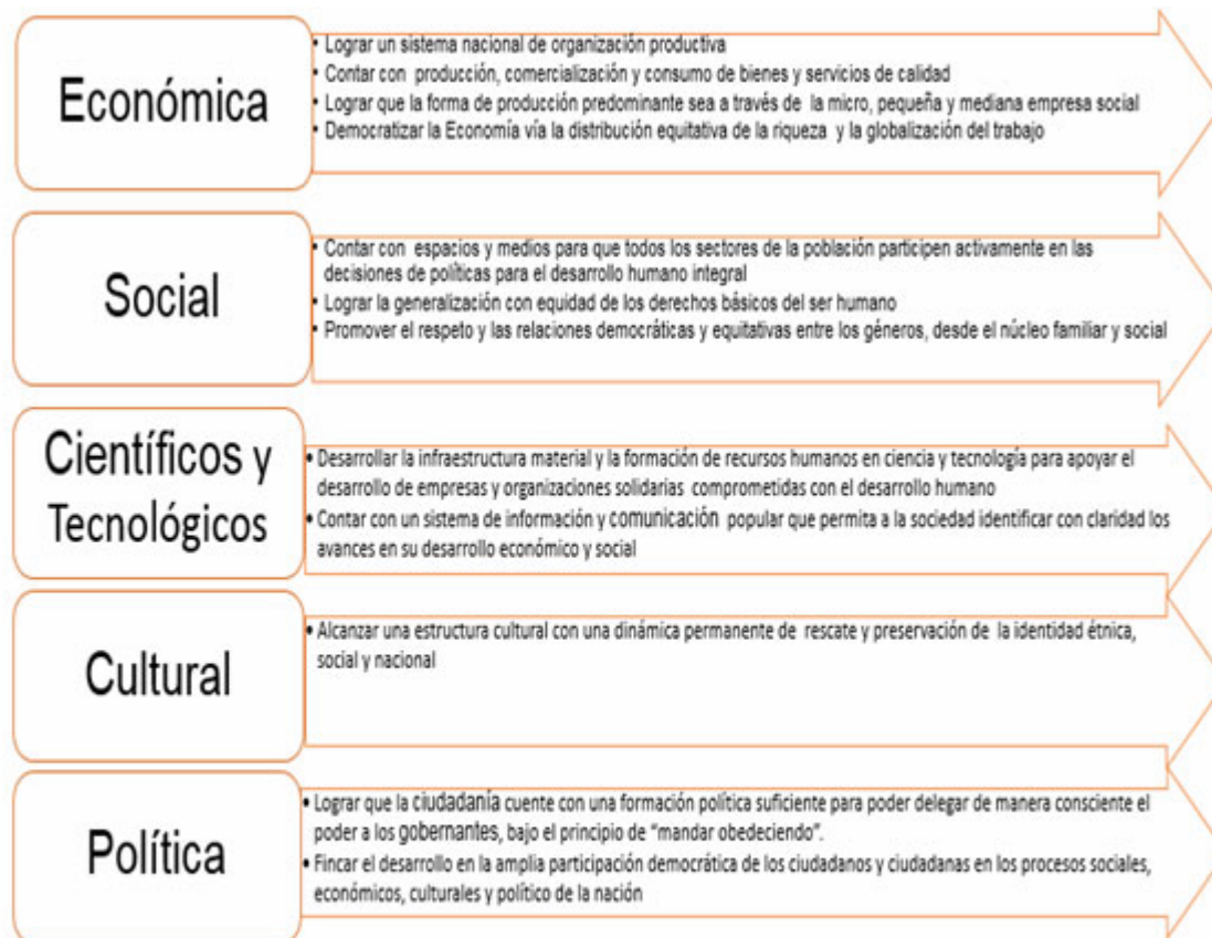
Figura 2. Dimensiones por Objetivos a considerar en la economía popular y solidaria (Fonteneau, Nyssens & Fall, 1999).

Es por ello que, en correspondencia con la concepción de EPS analizada, Fonteneau, Nyssens & Fall (1999) se identifican una serie de objetivos a desplegar en la realización de este tipo de forma económica que va a tributar al desarrollo local. Dichos objetivos se relacionan por dimensiones para lo cual se identifica la dimensión: económica, social, cultural y política (figura 2).