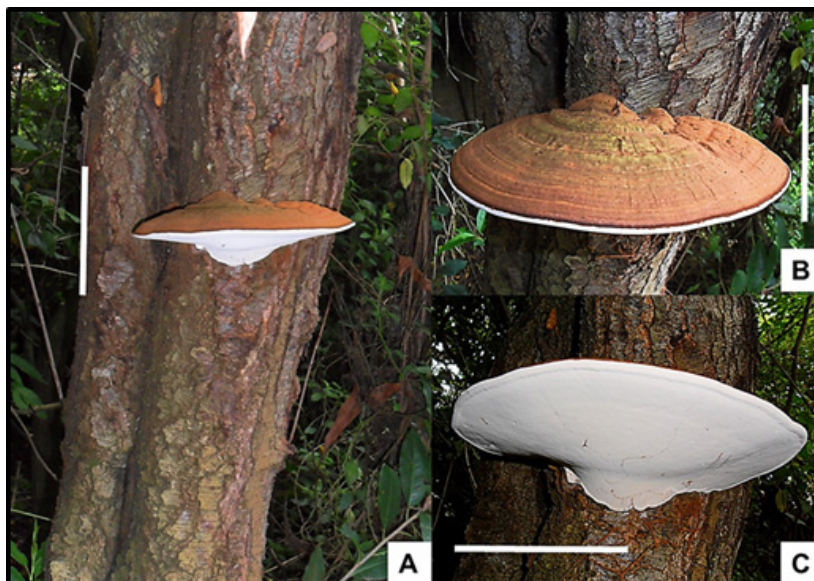
Figura 2. Registro fotográfico de Ganoderma australe . A. Basidiocarpo, B. Píleo, C. Himenóforo unilateral. Líneas 10 cm.

Esporada: marrón con tintes rojizos. Esporas: 6.2-13.3 x 4-7.5 \mu\text{m} , Q= 1.2-1-6, elipsoidales, ornamentadas, truncadas, con columnelas, ovoides, gutuladas, con doble pared, siendo la interna ornamentada y la externa lisa, color café rojizas a amarillentas, exosporium con paredes hasta de 0.4 \mu\text{m} de espesor. Basidios: 14-18 x 5-12 \mu\text{m} , cilíndricos a cuadrados, espatulados, en algunos casos triangulares, 4-sterigmatados. Cistidios: no registrados. Sistema hifal: trimítico, hifas generativas fibuladas, hialinas, delgadas, 2-3 \mu\text{m} de grosor. Hifas esqueléticas amarillentas, paredes gruesas, 3-5 \mu\text{m} de ancho, algunas ramificadas a arboriformes. Hifas de unión amarillas claras, paredes delgadas tortuosas, algunas gruesas, 0.8-2.1 \mu\text{m} de ancho, pueden encontrarse ramificaciones delgadas de tipo arboriforme.