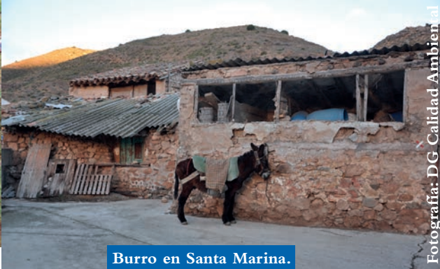
Burro en Santa Marina.