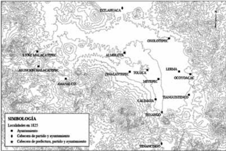
ILUSTRACIÓN 1. Organización estatal de la prefectura de Toluca en 1825*

* Ilustración elaborada por el Departamento de Sistemas de Información Geográfica de El Colegio de México, con datos tomados del índice de pueblos de Dorothy Tanck de Estrada, Atlas ilustrado de los pueblos de indios. Nueva España, 1800. Mapas de Jorge Luis Miranda García y Dorothy Tanck de Estrada, con la colaboración de Tania Lilia Chávez Soto , México, El Colegio de México, El Colegio Mexiquense, Comisión Nacional para el Desarrollo de los Pueblos Indígenas, Fomento Cultural Banamex, 2005; y de “Núm. 1. Estado que manifiesta los pueblos donde hay ayuntamientos en virtud de la ley de 9 de febrero de 1825, con expresión de las prefecturas y cabeceras de partido a que están sujetos”, en Memoria en que el Gobierno del Estado Libre de México da cuenta de los ramos de su administración al Congreso del mismo Estado, a consecuencia de su decreto de 16 de diciembre de 1825. Impresa de orden del Congreso , México, Imprenta a cargo de Rivera, 1826, página sin número.