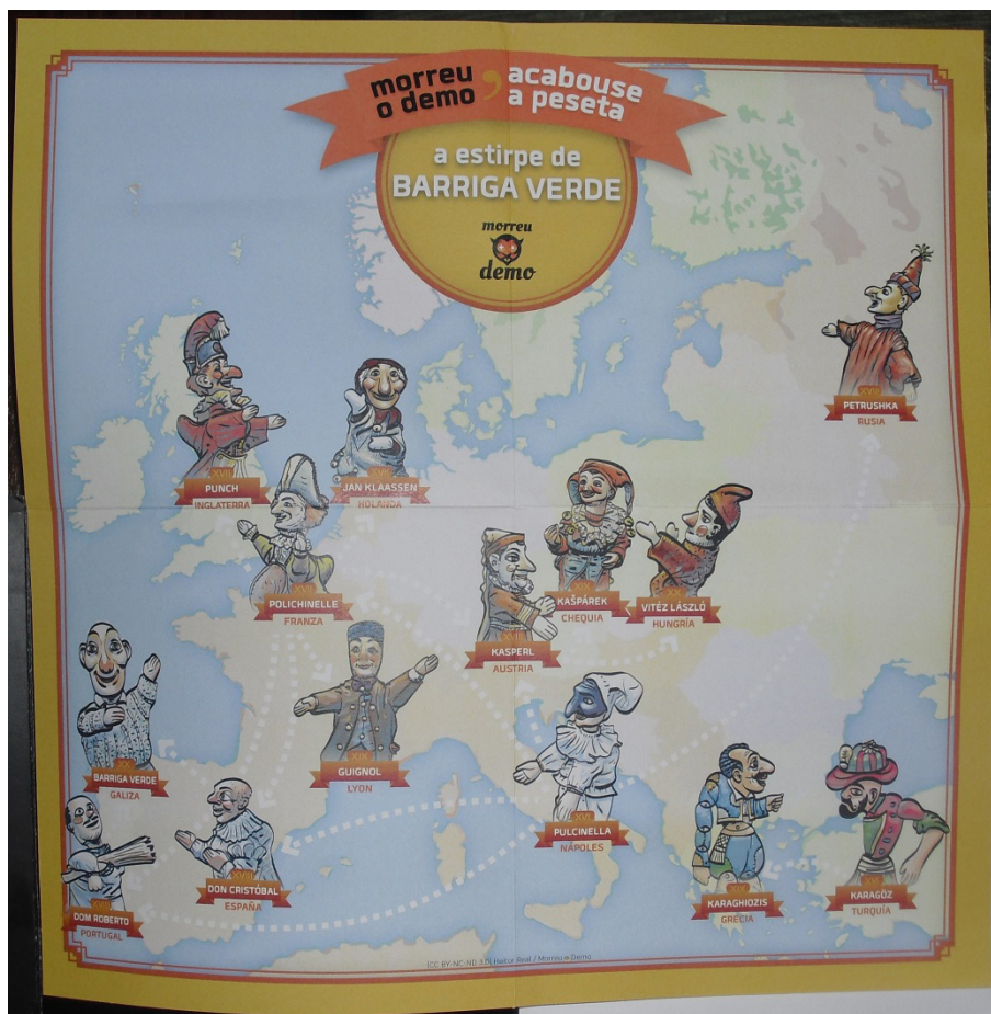
Imagem 04: Pôster sobre personagens do documentário transmídia.

que contam e dão vida aos personagens do documentário e serão lançados até o final de 2013.