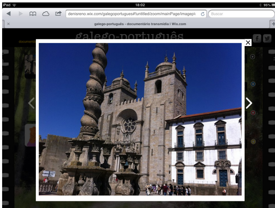
Imagem 06: Interface com exposição das fotografias.

sobre a relação existente entre as duas culturas. O vídeo foi produzido pelos dois dispositivos, desde a gravação até a edição final. Além disso, foram disponibilizadas fotografias de Aveiro, Porto, Covilhã e Santiago de Compostela, todas registradas a partir de iPad e iPhone e editadas no aplicativo Adobe Photoshop Express.