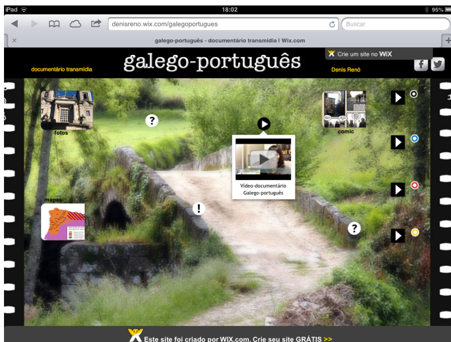
Imagem 05: Interface do documentário Galego-português .

partir da fotografia (Renó, 2013) e, para isso, construiu uma “instalação documental” na internet reunindo em uma única página todos os conteúdos. Para tanto, foi adotada como tecnologia de produção da página o aplicativo grátis Wix.com, que oferece tecnologia HTML5 na construção, e o aplicativo também gratuito ThingLink.com, que possibilita a instalação de links dentro de uma imagem. Com isso, tornou-se possível a produção de uma interface navegável e sem barra de rolagem, permitindo ao usuário uma navegação tátil e centrada na visualização geral (Imagem 05).