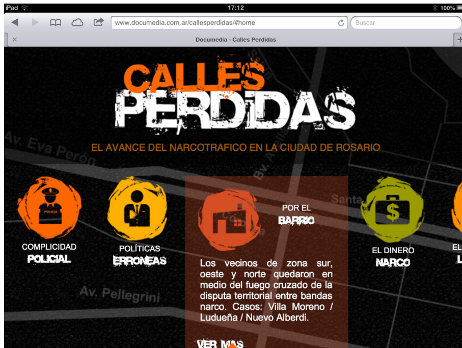
Imagem 01: Interface principal documentário “ Calles perdidas ”.

No que se refere à interface, o documentário apresenta um conceito simples e que constrói a relação entre o usuário e o conteúdo a partir do que Manovich (2005) denomina como interface arbórea (Imagem 01). Porém, distribui a navegação de maneira vertical, o que segue na contramão da usabilidade de dispositivos móveis (Renó, 2013). Ainda assim, é de simples navegação e atende ao que Carlos Scolari (2004) define como interface semio-cognitiva.