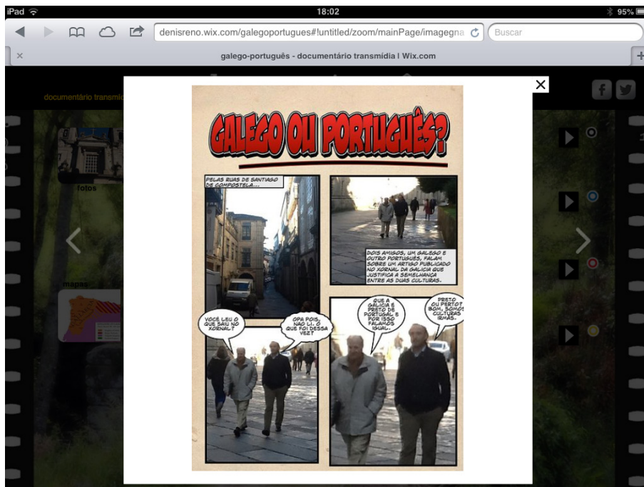
Imagem 07: Comic produzido para o documentário.

O conteúdo textual foi oferecido a partir de um link para uma publicação de uma crônica sobre a descoberta dessa semelhança cultural em um blog, produzido também com a utilização de um iPad. Por fim, para complementar esses conteúdos, foi produzido um comic que ilustrava o diálogo entre portugueses e galegos no dia a dia (Imagem 07), enquanto caminhavam pelas ruas de Santiago de Compostela. Neste sentido, Carlos Scolari (2013) define de maneira interessante a adoção de comics em ambientes transmídia, justificando que se trata da história contada por outros olhares. A adoção de comic em um documentário é uma tendência impressa também em obras com narrativas tradicionais.