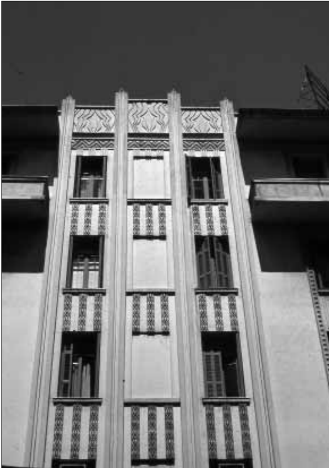
Fig 10. Thessaloniki. L'immeuble Koffas, detail de la façade (I. Zachariadis, 1925).