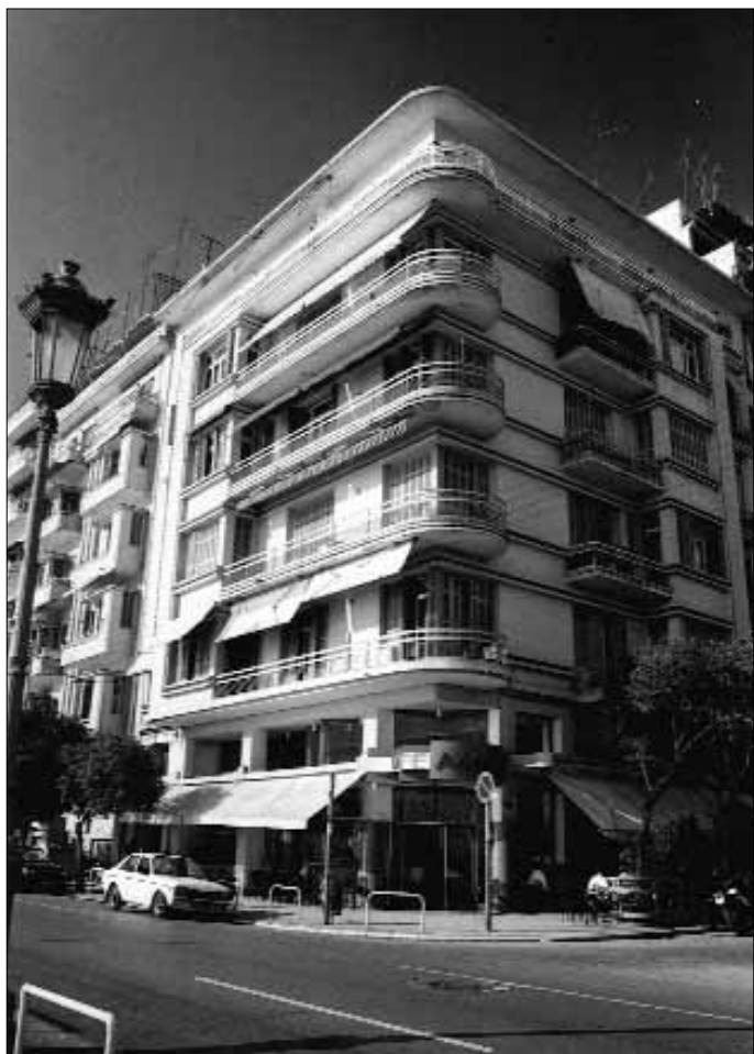
Fig 17. Thessaloniki. L'immeuble G. Malakis - G. Papamanolis (G. Malakis, 1930) sur le front de mer.