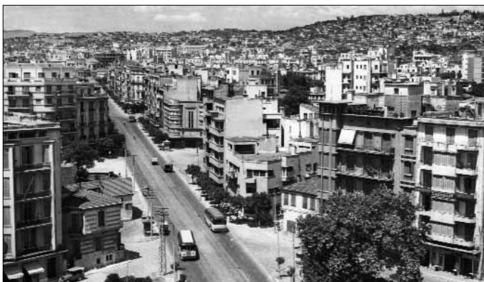
Fig 15. Thessaloniki. La rue P. Mela en 1951. Au centre, le cinéma Élysées (L. Zoidis, 1930).