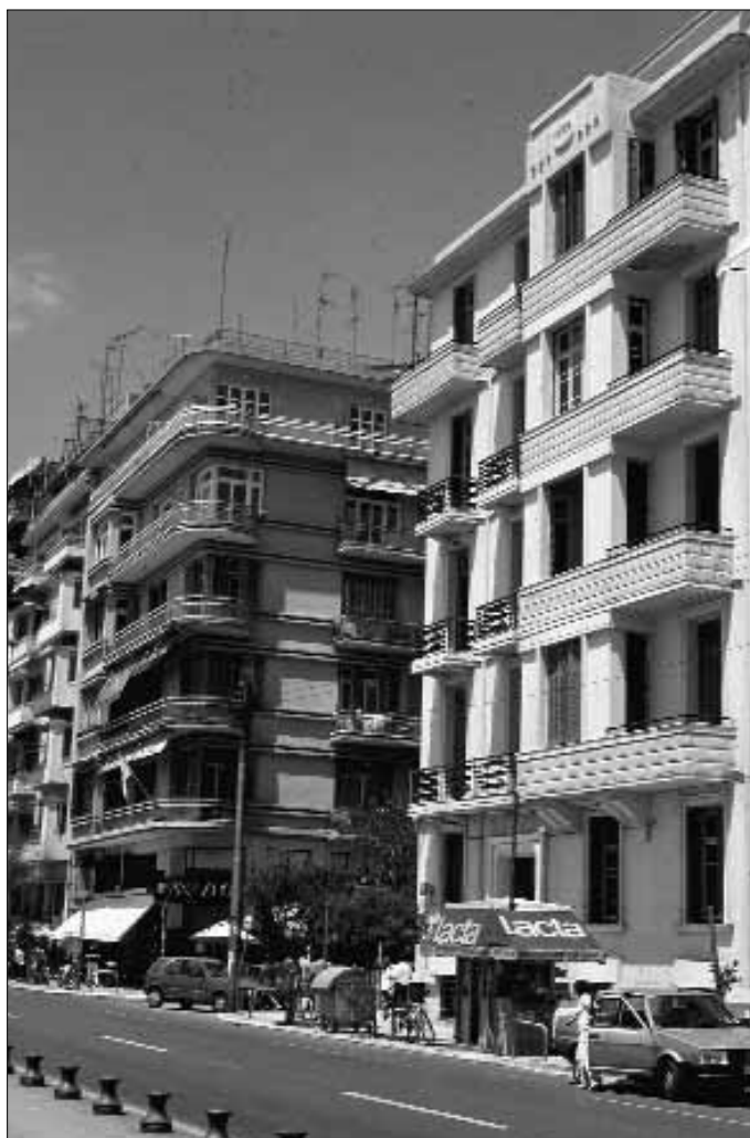
Fig. 16. Thessaloniki. Les immeubles I. Mandalidis (E. Modiano, 1931) et G. Malakis-G. Papamanolis (G. Malakis, 1930) sur le front de mer.