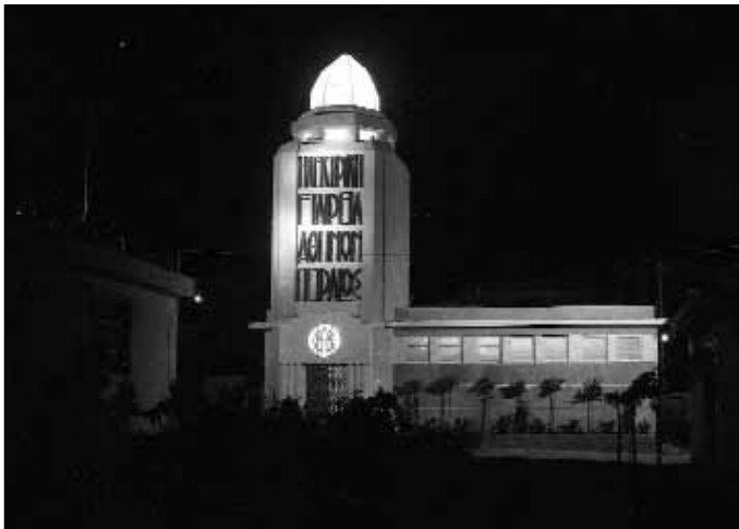
Fig 14. Foire Internationale de Thessaloniki. Le pavillon de la Société Electrique d'Athènes et Pirée (E. Lazaridis, c. 1928).