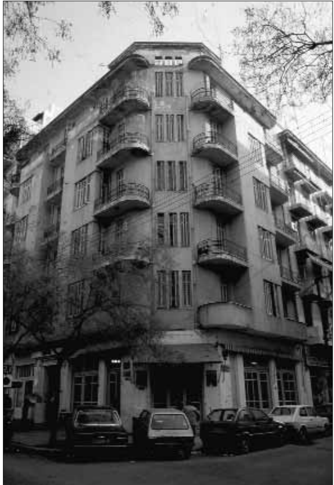
Fig. 21. Thessaloniki. L'immeuble des frères Afias, rue Antigonidon (M. Roubens, 1935).