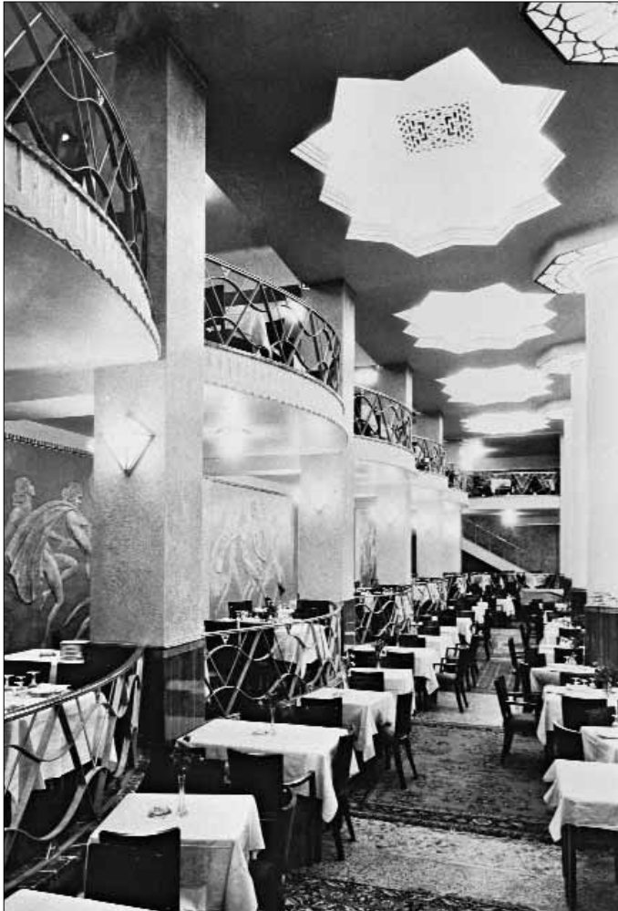
Fig 4. Athènes. Le Dancing «Maxim» (L. Bonis - V. Cassandras, 1937).