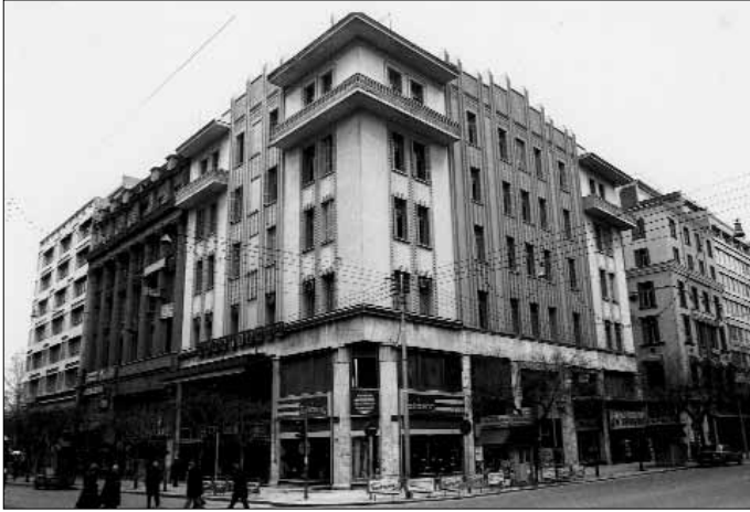
Fig 9. Thessaloniki. L'immeuble Koffas, rue Tsimiski (I. Zachariadis, 1925).