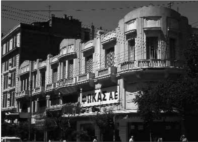
Fig 13. Thessaloniki. Les grands magasins Fokas, rue Venizelos (c. 1935).