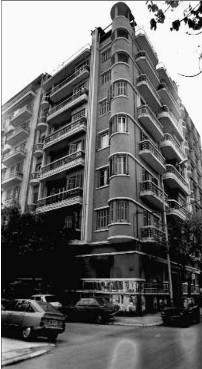
Fig 22. Thessaloniki. L'immeuble Guinis, rue Makenzie King (A. Tzonis - L. Palaiologos, 1935).