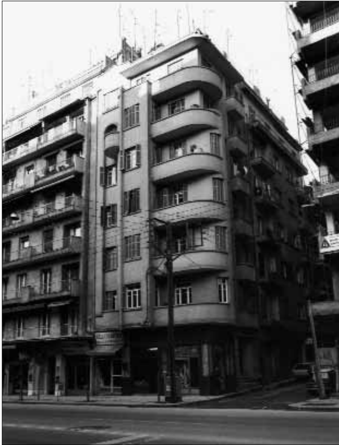
Fig 20. Thessaloniki. L'immeuble Vafiadis, rue Egnatia (G. Manousos).