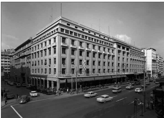
Fig 5. Athènes. Le palais de la Caisse de Retraite de l'Armée, le bâtiment donnant sur la rue Panepistimiou (L. Bonis - V. Cassandras, 1939).