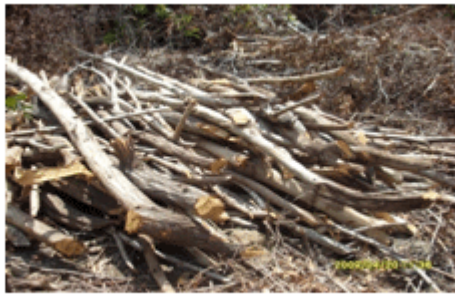
Figura 2. Explotación de leña y carbón dentro del manglar.

En el análisis del comportamiento de la existencia por área, el mayor valor corresponde a Ac, lo que es debido al grado de conservación que este muestra, las actividades humanas no han afectado aun el lugar. Los demás valores (Aa, Ad) son muy bajos; existen reportes de valores de existencias para este tipo de vegetación superiores como los reportados por Rodríguez (2003) de 30,2 m 3 /ha y Samón (2009) de 24,2 m 3 /ha. La figura 2 muestra la explotación de los recursos de la zona antropizada Aa.