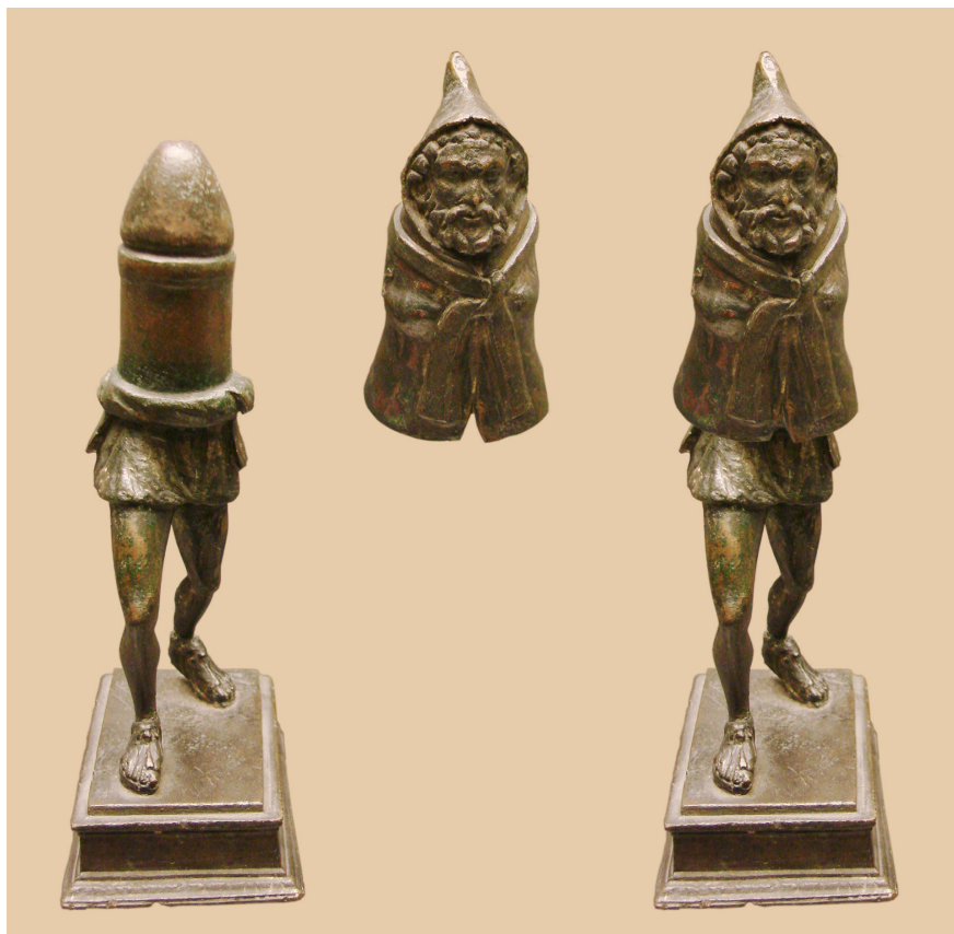
Fig. 2. Príapo de Rivery (Somme). Segunda mitad del siglo I d. de C. Musée de Picardie (Amiens).

El propio Brunelleschi había retomado la imagen del espinario –en el relieve del sacrificio de Isaac– cuando se presentó al concurso para las puertas del baptisterio de Florencia en 1401. En 1481 volvería a ser utilizado por Sandro Botticelli a la hora de pintar a Moisés descalzándose – para acudir hacia la zarza ardiente– en la Capilla Sixtina. Jan Gossaert, que hacia 1508-1509 viajó hasta Roma con su patrón Felipe de Borgoña, dibujaría un espinario desde un punto de vista muy bajo, reforzando así su sentido erótico ( Rijksuniversiteit Pretenkabinett de Leiden) 12 . Dentro ya del ámbito hispano el espinario se talló hacia 1535 en el banco del trascoro de la catedral de León, obra cercana al estilo de Juan de Juni y Guillén Doncel, formando parte de una serie de putti 13 .