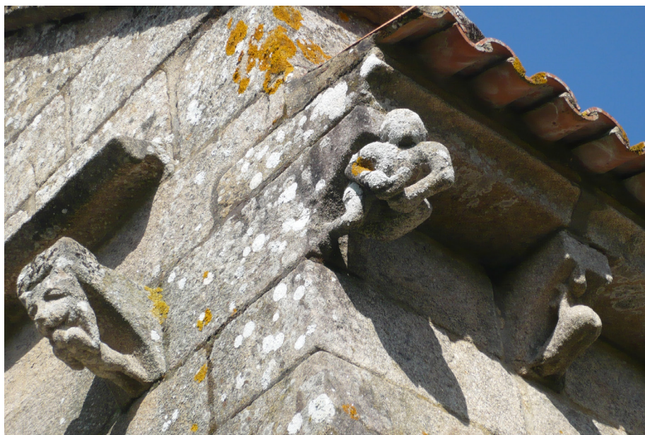
Fig. 4. Espinario en la cornisa de San Pedro de Ansemil (Pontevedra).

Son innumerables los espinarios peninsulares que asoman en época románica: en la catedral de Lugo, San Salvador de Sobrado de Trives, Santo Tomé de Serantes, Santa Cristina de Lavadores (Vigo), San Martiño de Mondoñedo, San Xoán de Meaño, San Pedro de Ansemil [fig. 4], San Martín de Elines, San Pedro de Cervatos, Santa Cruz de Castañeda, Matalbaniega, San Pedro de Tejada, San Salvador de Leyre, Duratón, El Olmo, Santos Justo y Pastor de Sepúlveda (y tal vez San Clemente en la capital de Segovia), San Vicente de Ávila, Abajas [fig. 5] (y tal vez Hormaza), Vizcaínos de la Sierra, San Prudencio de Armentia, la Asunción de Villavelayo, San Cristóbal de Larraona, Santa Maria de Covet, Pisón de Castrejón o la pila bautismal de Robladillo de Ucieza 23 .