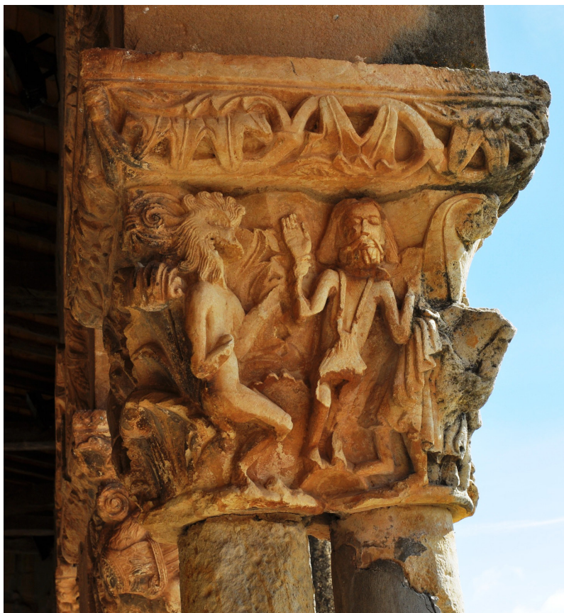
Fig. 7. Galería porticada en la iglesia parroquial de San Julián y Santa Basilisa. Rebolledo de la Torre (Burgos). Capitel doble representado la condenación y muerte del avariento.