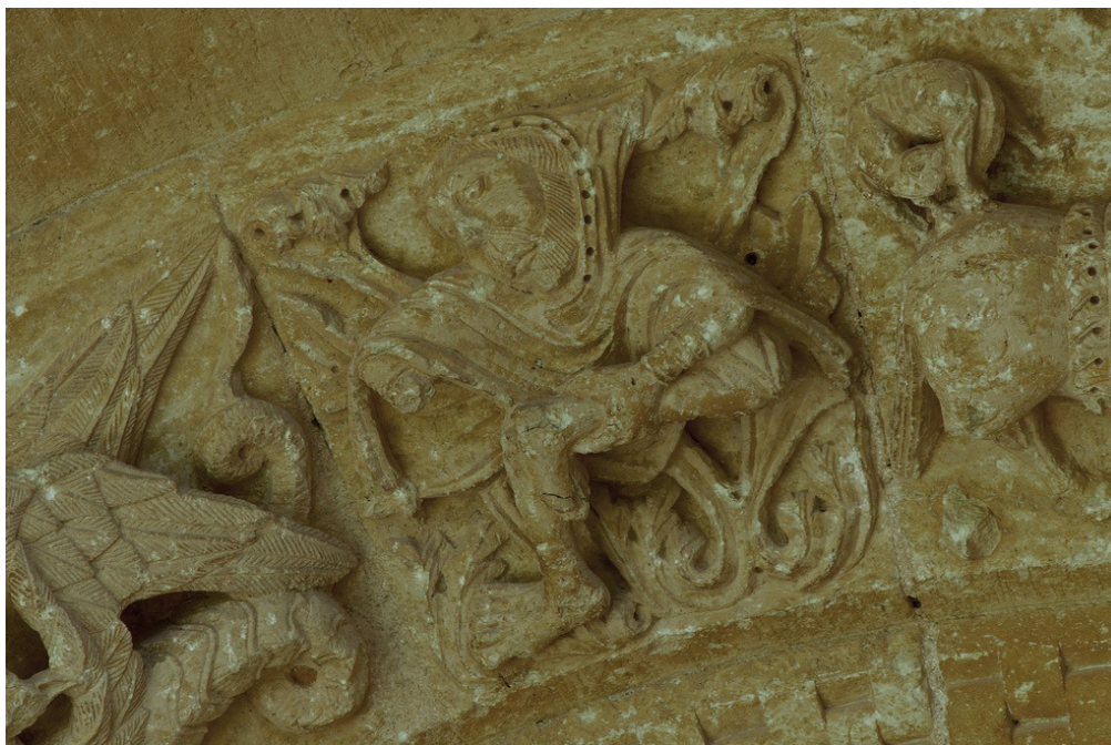
Fig. 5. Espinario en la portada meridional de Santa María la Mayor de Abajas (Burgos).