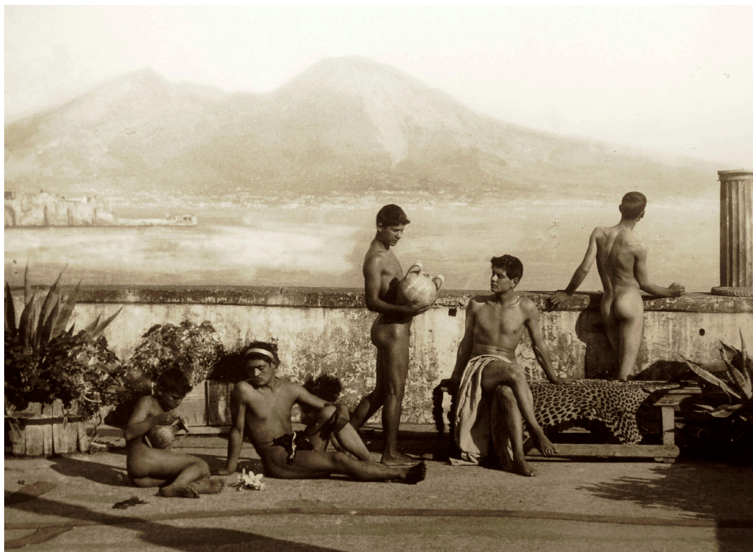
Fig. 10. Terra del fuoco o Jóvenes napolitanos en la terraza . Fotografía de Wilhelm von Gloeden (1856-1931).