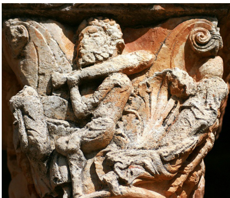
Fig. 8. Galería porticada en la iglesia parroquial de San Julián y Santa Basilisa. Rebolledo de la Torre (Burgos). Capitel doble representado la condenación y muerte del avariento. Detalle de Tobías con el pez.