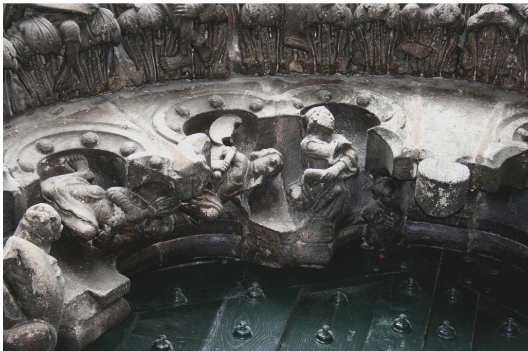
Fig. 3. Salomón y Marcolfo. Portada meridional de la catedral de Orense.

El profesor Moralejo, autor de un impagable estudio sobre la aparición de Marcolfo en la portada meridional de la catedral de Orense [fig. 3] valoró la posibilidad de hablar del «necio como espinario», rasgo inherente a la entonces bien definida personalidad del Marcolfus follus y cuya postura denota o connota luxuria , apreciando infinidad de simiescos espinarios románicos en los que el mono pertenecía, por derecho propio, a la heráldica de la luxuria . ¿Acaso semejantes muebles se difundieron por toda Europa gracias a las peregrinaciones a Roma? 15 Inés Monteiro ha relacionado al espinario románico con el ídolo pagano por excelencia, reflejo del antagonista musulmán (los bíblicos madianitas y moabitas), suerte de fálico Belfegor asirio (Baal) adoptado por los hebreos y asimilado al Príapo antiguo 16 . En el infierno del Beato de Silos (1109-1116),