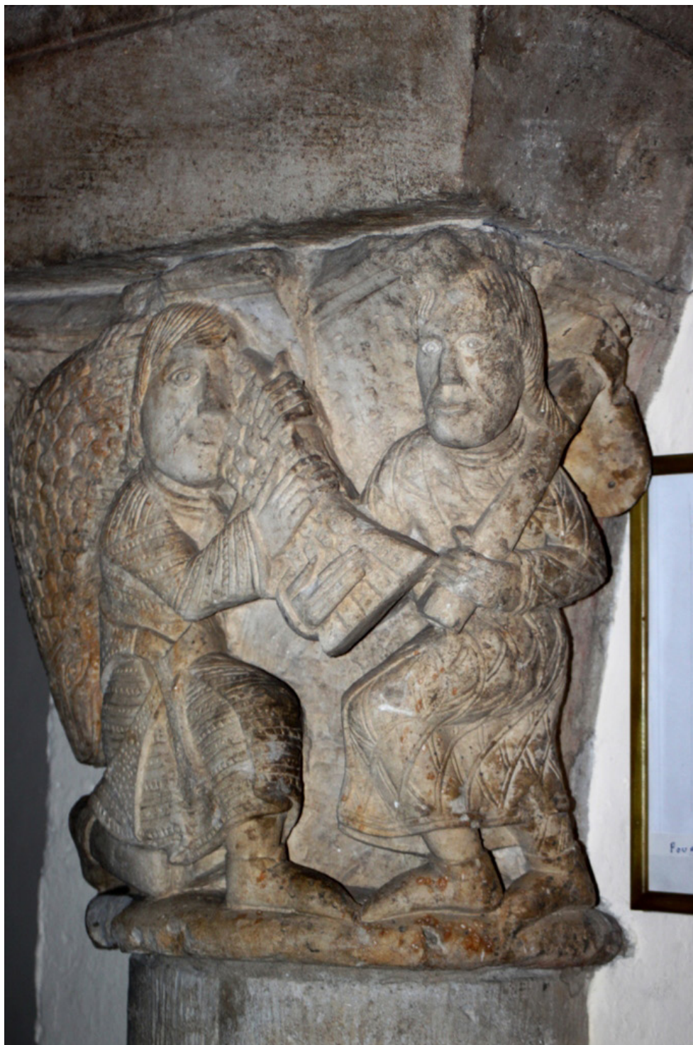
Fig. 9. Capitel procedente del priorato de Saint-Martin de Saujon en la parroquial de Saint-Jean-Baptiste (Charente-Maritime). Tobías con el pez y ¿criado de Ragüel?

Si nos atenemos al Libro de Tobías, el personaje portador de azadón podría identificarse con un criado enviado por Ragüel para enterrar a Tobías (que era hijo del primo hermano de Ragüel, de la tribu de Neftalí) pensando que había muerto tras contraer matrimonio con Sara, la hija de Ragüel, a cuyos siete maridos anteriores había matado el demonio Asmodeo y seguía siendo virgen. Por consejo de su compañero de viaje Azarías (en realidad se trataba del arcángel Rafael