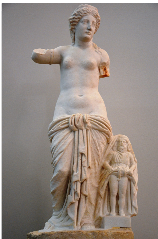
Fig. 1. Venus con Príapo procedente de Aenona (Nin). Inicios de la segunda mitad del siglo I d. de C. Museo Arqueológico de Split (Croacia).

En La lozana andaluza (1528) del eclesiástico Francisco Delicado (escrita unos 70 años más tarde que el Libro de vita beata de Lucena), el espinario en bronce –que ya habían trasladado al Campidoglio– era denominado «Rodriguillo español 9 », que es como decir Pierino o Jaimito, imagen identificada como un «adolescente apicarado» con el culo pelado de tanto vagar que había llegado hasta Italia descalzo y se entretenía sacándose una espina al sol para burlar el hambre, que en el mejor de los casos suelen llamar inadaptación 10 . Incluso los carmina priapea , redescubiertos a fines del siglo XIII, fueron muy difundidos hacia los siglos XV y XVI («¿De qué te ríes, estúpida muchacha? No me hizo Praxíteles, ni Escopas, ni me pulió la mano de Fidias, sino que un campesino desbastó un informe leño y me dijo: «Sé Príapo.» Sin embargo, tú me miras y te ríes. Sin duda te parece salada esta columna que se yergue rígida en mis ingles») [figs. 1-2]. En 1541 Niccolò Franco escribió La Priapea , una virulenta colección de sonetos lujurioso-satíricos (lo propio harán mucho después Goethe, Leandro Fernández de Moratín y hasta Rafael Alberti en Entre el clavel y la espada ) 11 .