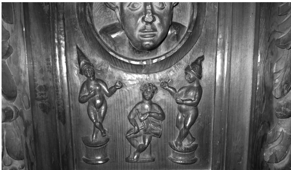
Figura 3. Imagen festiva del coro parroquial de Isaba, 2011 (P. Orduna Portús).