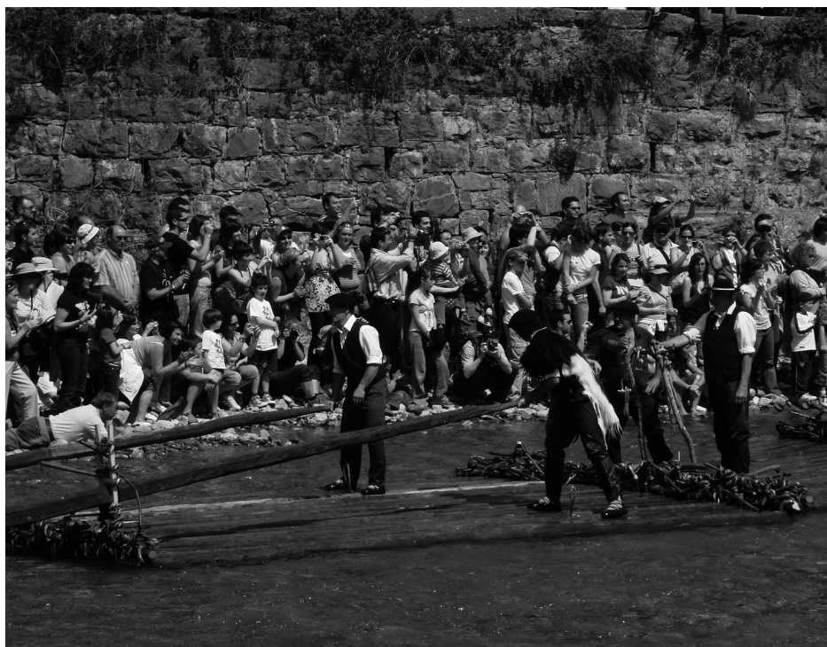
Figura 1. Fiesta de la almadía en Burgui, 2010 (P. Orduna Portús).

Para evaluar tal realidad nos basaremos en su propio desarrollo estacional. Recordemos que hablamos de fiestas religiosas, ganaderas, agrícolas y, a la par, que algunas de ellas son fijas y otras, por el contrario, móviles en el espacio cronológico del año. En resumen, quedarán encuadradas en el ciclo del otoño-invierno y el de la primavera-verano . O lo que es lo mismo, el momento de la «subida» y Puerto y la época de la «bajada» a las Bardenas o a Mauleón.