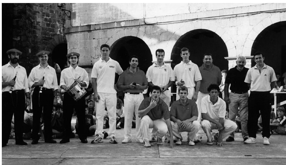
Figura 9. Foto tras el partido de pelota en Isaba durante las fiestas patronales. Años 90 del siglo xx.

Ya fuera en San Juan o por la Virgen del Carmen, el baile y la música, desde el soportal de las escuelas infantiles de la plaza, no han faltado. En el aska de al lado las cuadrillas de mozos y mozas se sacaban fotos con fotógrafos itinerantes. Se hacían, y hacen, comidas vecinales por los barrios. Los vecinos participaban en rondas nocturnas y diurnas –simpáticas a veces, conflictivas otras–. Para hacerlas se pedía permiso al alcalde y así evitar que las parara el alguacil. Cada mozo cantaba a su novia y si no sabía lo hacía un amigo. A veces, la familia de esta se enfurecía por las letras injuriosas y salían contra ellos. Y es que algunas iban destinadas a muchachas concretas y comenzaban con unos estribillos estándares (Navascués, 2011):