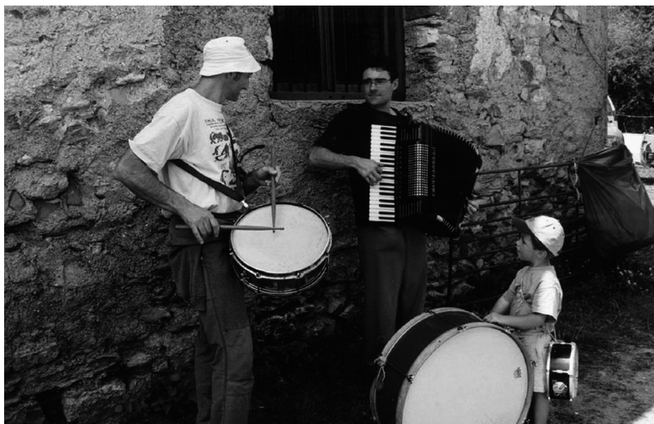
Figura 7. Sobremesa de comida y merienda en un bordal de Belagöa durante las fiestas por Santiago en Isaba. Años 90 del siglo xx.

pelota entre vecinos e interpueblos del valle. A posteriori , a estos lances en la cancha se sumaron los de futbito, cross , BTT, etc. Se trata de muestras de reafirmación individual en un contexto comunitario y festivo.