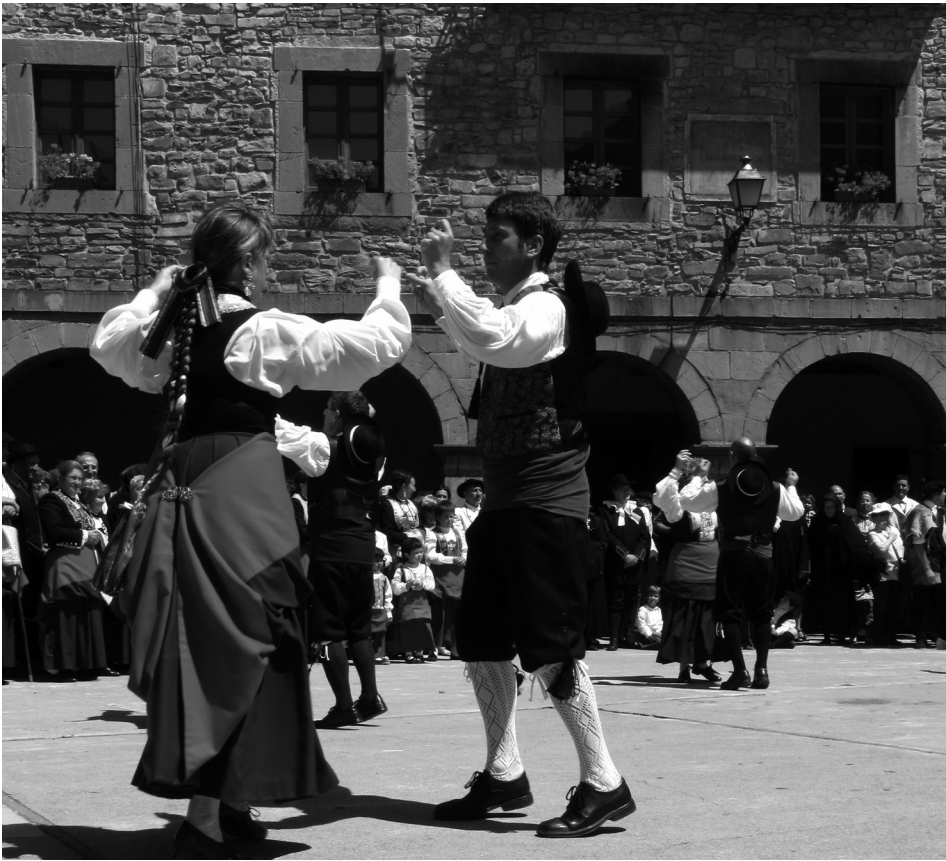
Figura 4. Tun-tun en la fiesta del Traje de Isaba, 2011 (P. Orduna Portús).

En los pueblos del valle, los niños cantaban canciones para pedir el aguinaldo siendo la más común y popular el Gairon Egunëan o Gairon-Gairona parecida al ya mencionado Natarabitatëa , que era cantada por muchachas en la tarde del día de Nochebuena (existían versiones sensiblemente diferentes en otros pueblos del valle) 2 : « Ai Maria, gairon gairona, sortu da Jain Ona, naterebitate urterebitarte... ».