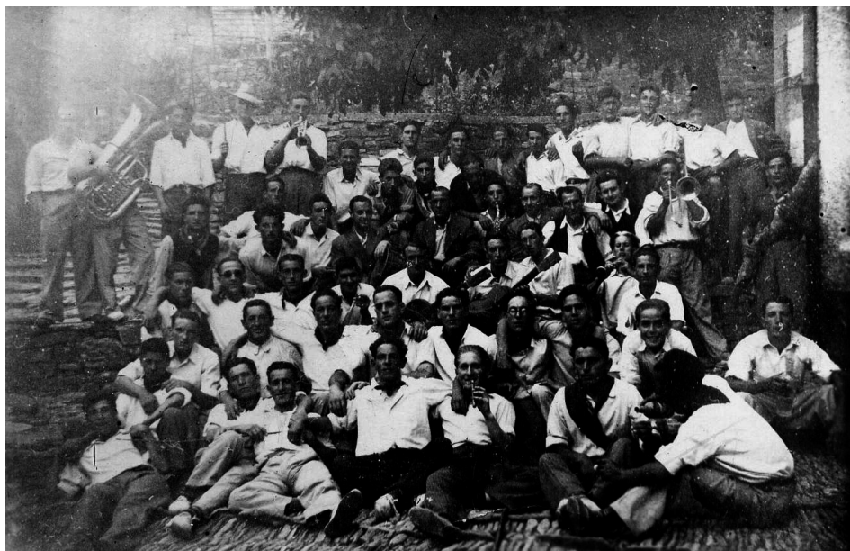
Figura 12. Berendolo en las fiestas patronales de Uztárroz, 1946.

terio. Estas concluían el 2 de julio con un último oficio en el que asistían los pastores para pedir protección en la Fiesta de los Mayorales. Ahora acude menos gente pero antes era concurrido y se hacía un aperitivo colectivo.