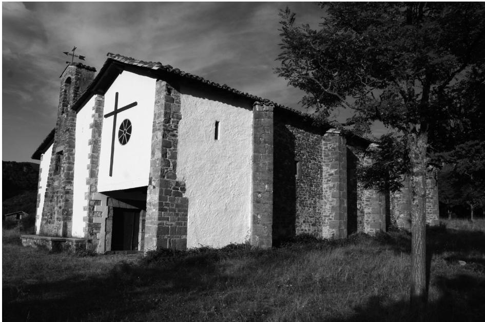
Figura 10. Ermita de la Virgen del Camino. Burgui, 2008.

Tras Resurrección la gente había olvidado ya la época de abstinencia y ayuno de la Cuaresma. Parejo a ese momento de liberación espiritual se producía una aceleración de la vida religiosa y popular, lejos del de cualquier recogimiento. Llegaba la temporada del calor y las labores del Puerto y con ella muchos de los temores cíclicos de los roncaleses: las tormentas, las riadas, las heladas tempranas. Se trataba de una época de miedos y rogativas, aunque, a la par, comenzaba de nuevo el tiempo de celebraciones y alegrías por todas las ermitas de los siete pueblos del valle. Aunque hay que señalar que durante el resto del año muchas de estas visitas también tenían lugar, y de ellas se da mención. Así, por ejemplo, al arciprestazgo del valle le tocaba cada tres años ir el 3 de diciembre al castillo de Javier para celebrar la Novena de la Gracia. Ahí se desplazan los representantes de las autoridades, varios danzantes y vecinos. Tras la misa se le baila el ttun-ttun al santo.