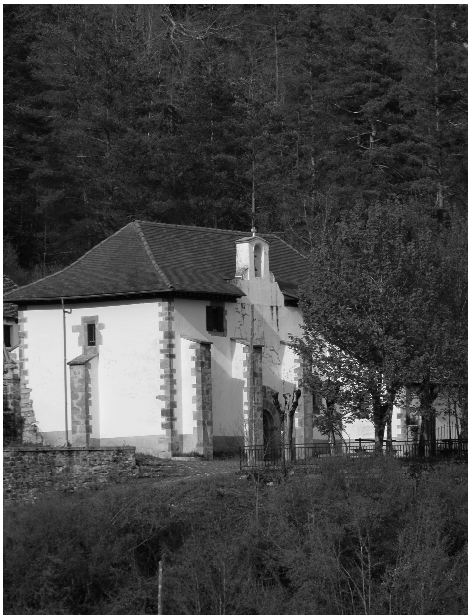
Figura 11. Ermita de la Virgen del Patrocinio en Uztárroz, 2013.

del camino virgen pura» (Mauleón, 2009: 51). Otro lugar de peregrinación romera de los burgiarras es el santuario de la Virgen de la Peña. En 1520 se creó una cofradía estable con diez miembros de Burgui y veinte de Salvatierra de Esca (Aragón) (Induráin, 2010: 291-295). La ermita se encuentra cerca de la muga pero en el término salvaterrano y la devoción es grande por ambos lados de la raya. Todos los Lunes de Pentecostés suben los cofrades aragoneses y el domingo anterior los de Burgui. El 2 de agosto la romería es conjunta. Además, el papa Pío VII les concedió una indulgencia extra y el Jubileo de la Porciúncula a quienes fueran el 8 de septiembre por Natividad de la Virgen. Ese día se celebra la fiesta de la Cofradía. Suben de ambos lados el día de antes vestidos de gala y pernoctan ahí en sus propias dependencias. A la siguiente jornada acuden a misa juntos.