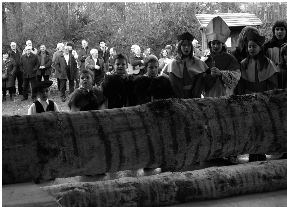
Figura 2. Fiesta del Obispillo de Burgui, 2010 (R. Ezker).

Así, cada año en Burgui, el día 6 de diciembre se celebra la fiesta de dicho santo, patrón también de los almadieros. Antes solo ejercía ese cargo un niño pero desde hace varios años las chiquillas también tienen cabida en los papeles principales de dicha cuestación. Los protagonistas son elegidos por el alcalde que normalmente se decanta por los infantes (excluyendo a los ya adolescentes) de mayor edad para los cargos de obispo y canónigos. Una vez elegidos, en su día, San Nicolás recorre las calles del pueblo, casa a casa, pidiendo una cuestación ( esketëa ) en las puertas a cambio de una bendición: «La bendición del Espíritu Santo. La bendición de Dios Padre. La bendición de Dios Hijo. Que Dios descienda sobre esta casa. Queda bendecida». También están el alcalde y teniente de alcalde representados en la comitiva. Estos llevan gorros militares y el alcalde una vara de mando y un zakuto . Por su arte, el teniente alcalde lleva un gerren , o espado, para ensartar las «txulas» recogidas.