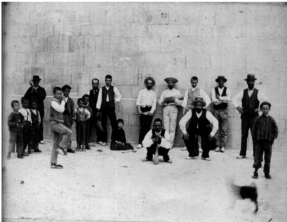
Figura 8. Posando en el frontón de Isaba. Siglo XIX.

Que por acuerdo del Ayuntamiento de Veintena de mi presidencia y de conformidad con las autoridades eclesiásticas, se han trasladado las fiestas patronales que esta villa celebraba el día de San Juan 24 de junio al día de la Virgen del Carmen 16 de julio, en cuyo honor y por espacio de tres días tendrán lugar, tanto los actos cívicos como los religiosos, en la forma que antes se celebraba en la fecha anterior. Lo que se hace público por este EDICTO para su conocimiento. Uztárroz, 15 de julio de 1909. El Alcalde». [Archivo Municipal de Uztárroz] (cit. Uztárroz-Uztrotze , 2010: 27).