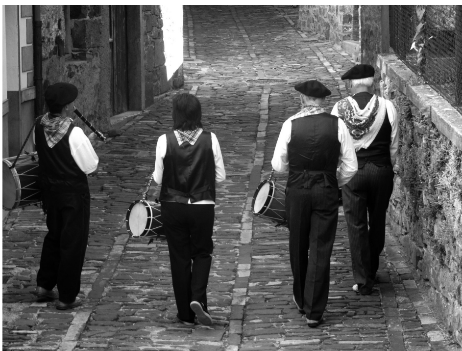
Figura 6. Txistularis en las Fiestas de Santiago de Isaba, 2012 (P. Orduna Portús).