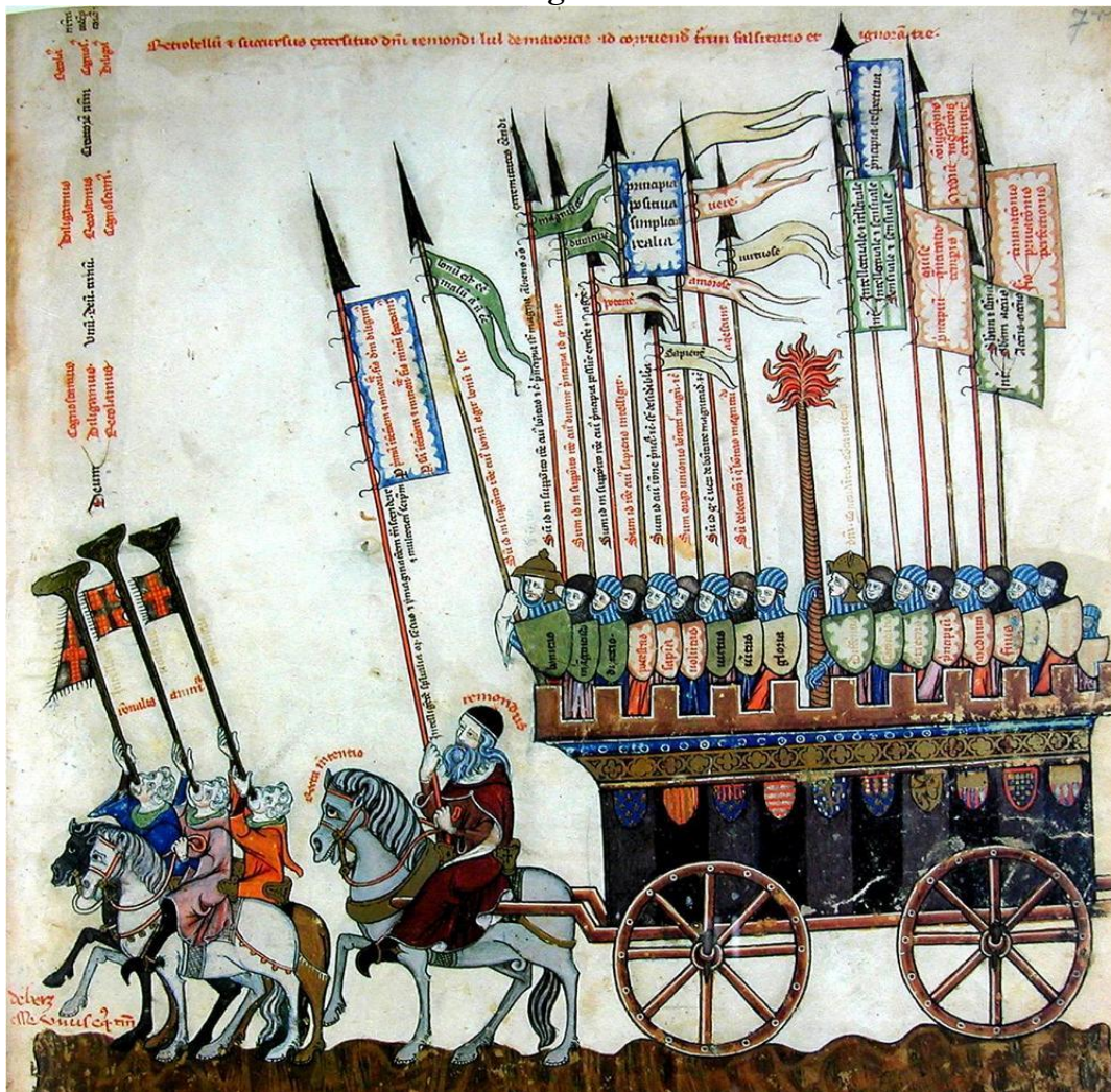
Iluminura VII do Breviculum (1325). Badische Landesbibliothek de Karlsruhe, Alemanha. Codex St. Peter, perg. 92.