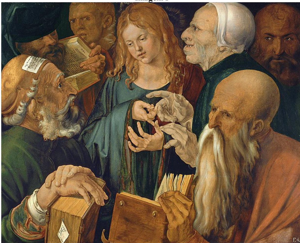
Cristo com os doutores (1506), de Albrecht Dürer (1471-1528). Óleo sobre painel, 65 x 80 cm, Museo Thyssen-Bornemisza, Madrid.