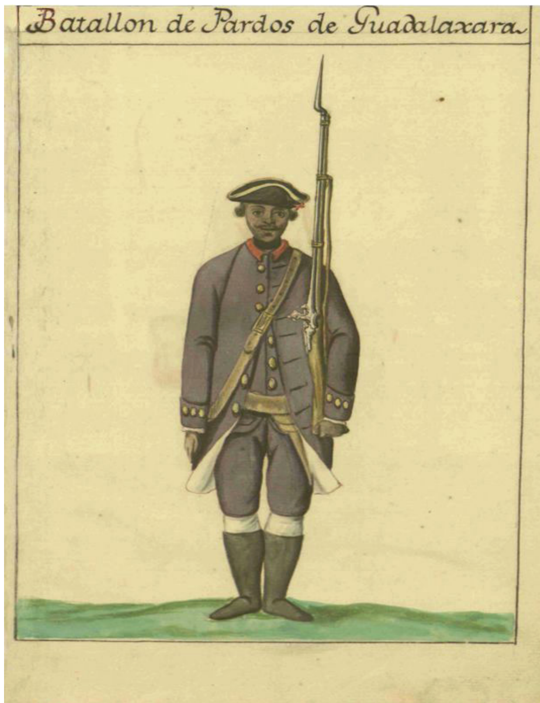
Figura 1. Uniforme del Batallón de Pardos de Guadalajara 1771

Fecha: 1771.