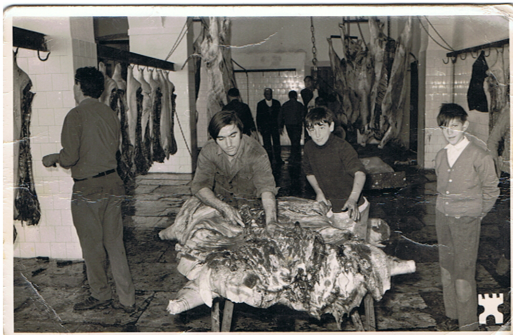
Matadero de Almendralejo, hacia 1960