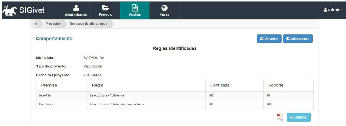
Figura 1. Patrones de comportamiento identificados.

Con el fin de ofrecer un contexto amplio al análisis de los resultados de las pruebas de hemograma, el sistema permite graficar el comportamiento de las alteraciones y variables en estudio.