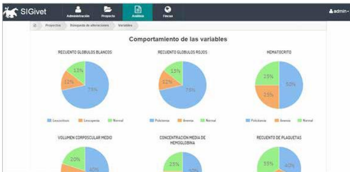
Figura 3. Comportamiento de las variables.

Comportamiento de variables: comportamiento de variables cuenta el número de individuos que presentaron valores normales y valores alterados para cada variable de las pruebas de hemograma, tal como se visualiza en la Fig.3.