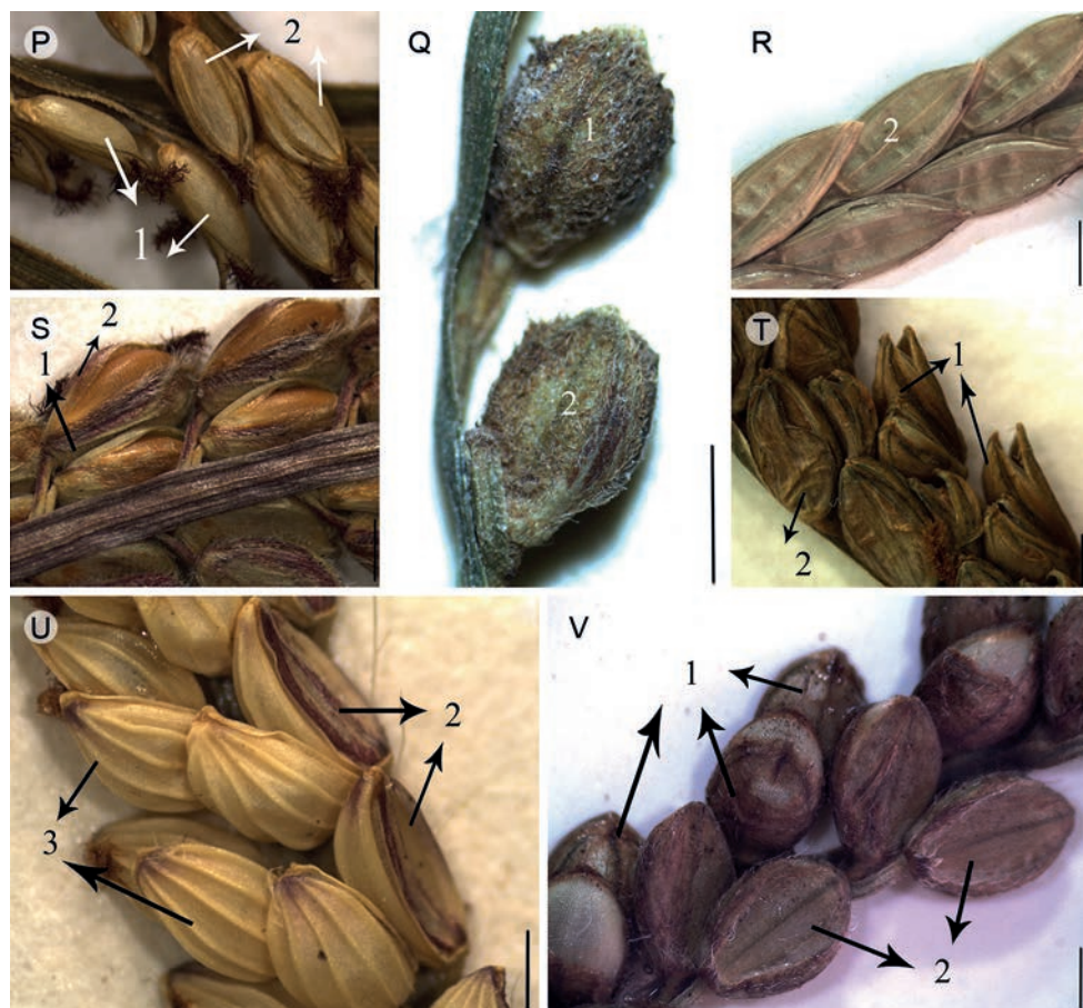
Fig. 1. Continuación. P. P. repens ; Q. P. sparsum ; R. P. vaginatum ; S. P. virgatum ; T. P. wrightii ; U. P. malacophyllum ; V. P. botterii . 1. gluma superior; 2. lema inferior; 3. lema superior. Escala 1 mm.

Perennes, cespitosas, bases nodulosas. Culmos erectos o ascendentes, simples, 30-100 cm alto; entrenudos y nudos glabros. Hojas con vainas comprimidas, pelosas en el margen y hacia el ápice; lígula 0.7-2.5 mm largo; láminas 15-30 cm largo, 7-15 mm de ancho, lineares, aplanadas, esparcidamente pelosas y adpreso pubescente en el envés, márgenes ciliados hacia la base. Sinflorescencia 9-17 cm con 2-8 racimos de 4-9 cm largo, de ascendentes o divergentes, laxos; raquis 0.3-0.5 mm de ancho, angosto, glabrescente, con una espiguilla en el ápice, triquetro. Espiguillas 2-2.5 mm largo, 1-1.1 mm de ancho, elípticas, solitarias o raramente