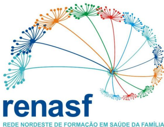
Figura 2: Logotipo da Rede Nordeste de Formação em Saúde da Família – RENASF.

O logotipo, ou como preferencialmente chamamos, o símbolo da RENASF foi construído com o apoio de uma consultoria e teve vários termos de referência, por exemplo, inovação, rede, relacionamento, interface, união de vários agentes, formação profissional, articulação, Estratégia Saúde da Família, proximidade. Na imagem do símbolo, duas figuras são utilizadas, a espiral áurea e o dente-de-leão (também conhecido como esperança). A motivação para esta utilização relaciona-se à forma com que a RENASF foi concebida, em que todos seus integrantes possuem relevância, detêm um núcleo comum, relacionam-se de forma harmônica, fortalecem-se de forma recíproca, aprendem e crescem com as diferenças e juntos são mais fortes, sem, entretanto, desvalorizar as especificidades de cada membro.