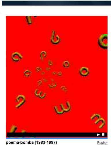
Figura 1 – Versão animada do poema “Bomba”, de Augusto de Campos

movimento. Ainda na década de 1980, também foi produzida uma versão holográfica para esse mesmo poema, e em 1997, utilizando o programa Flash , Augusto de Campos produziu uma versão multimídia, que pode ser acessada em seu site oficial. 3