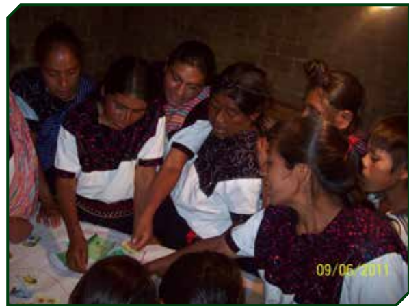
Figuras 3. Reunión grupal, complemento de las entrevistas con mujeres en la comunidad de Bachén , municipio de San Andrés Larráinzar, estado de Chiapas, México.

Posterior a las entrevistas, cuando el ciclo de visitas a cada una de las familias culminó, se formaron grupos pequeños de trabajo (de 5-6 personas), con el fin de consensuar toda la información proporcionada con anticipación en las entrevistas. En estas reuniones grupales se promovieron las conversaciones, discusiones e intercambio de ideas sobre los insectos útiles en su localidad (Figura 3).