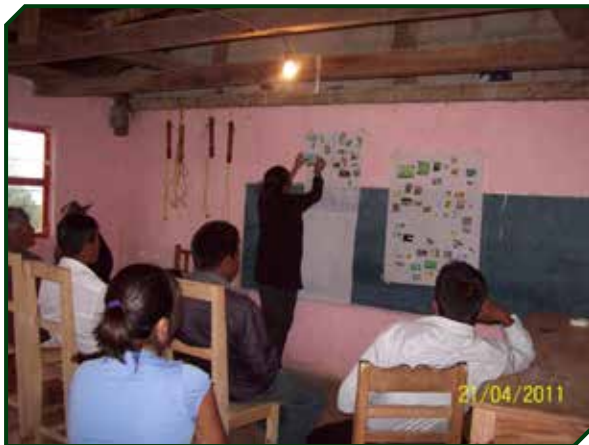
Figura 2. Identificación de nombres locales de la entomofauna con moradores de Bachén , municipio de San Andrés Larráinzar, Chiapas, México.

En todas las salidas a campo se contó con la participación de un guía y traductor local, aunado a que E. López (primera autora) tiene como lengua materna el tsotsil. Al inicio del trabajo de campo en el paraje de Bachén se realizó un taller participativo con hombres y mujeres mayores de edad, así como con jóvenes, que permitió dar a conocer los objetivos y metodología a seguir del proyecto de investigación y, por otra parte, localizar a personas poseedoras de un mayor conocimiento al respecto del tema de estudio ( sensu López et al. , 2013). Además, se inició con la identificación de algunos nombres particulares para los insectos útiles en la comunidad (Figura 2).