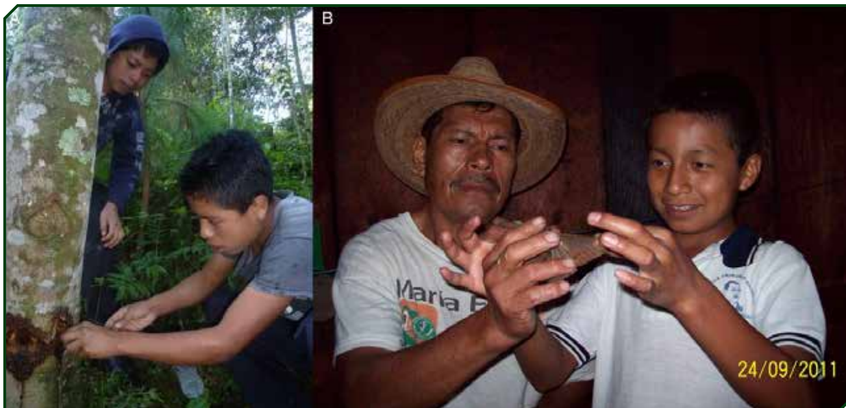
Figura 4. A) Colectas participativas de Schausiana trojesa (Ontivas). B) Colectas participativas de Ascalapha odorata (Ik'al pepen).

en recipiente plásticos, que para el caso de los estados inmaduros (larvas principalmente) se utilizó líquido de Pampel que actúa como fijador de éstos, en un tiempo de 48 a 72 hrs, para posteriormente pasarlos a alcohol al 70-95%. Todos los ejemplares adultos se incluyeron en alcohol al 80% para su posterior identificación (Gómez y Jones, 2002).