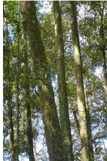
Árbol de jaúl.

Sus flores son monoicas, en grupos racimosos o en espigas, de color amarillentas. Produce frutos tipo cono (estróbilos) en infrutescencias, secas dehiscentes, de aproximadamente 2 cm de largo. El fruto verdadero es seco, tipo sámara indehiscente con una bráctea alada, comprimida y ovoide de aproximadamente 3 mm de largo y 2 mm de ancho, de color café claro. Las semillas son de forma ovoide o elíptica, de 2 mm de largo, de color blanco, lisas, lustrosas y muy delgadas.