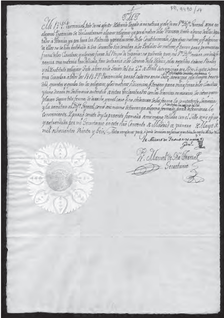
Fig.1. Carta de fray Manuel de Santa Teresa, secretario del Definitorio General, al Prior Provincial de la Provincia de Santa Ana, en la que le comunica el acuerdo adoptado por el Definitorio General en la sesión del día 27 de abril sobre los religiosos excomunados (1-5-1826). (FM,9490/14).