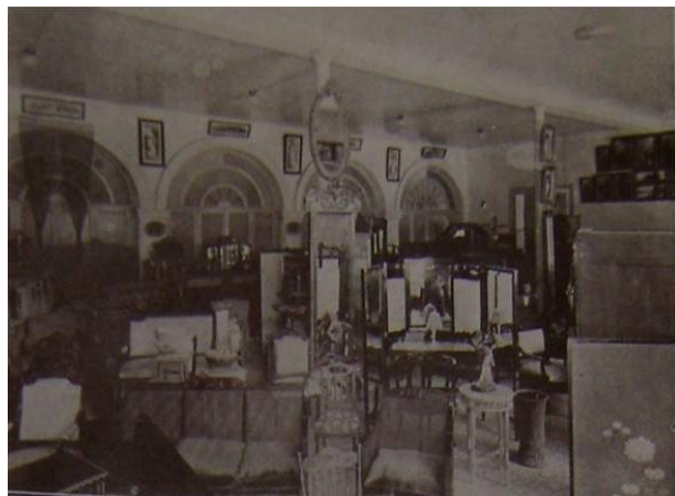
Fig. 6. Departamento de exhibición y ventas de la mueblería Viuda de Villapol Fernández y Ca. En 1919. Revista El Fígaro , La Habana, 1919, p. 530.