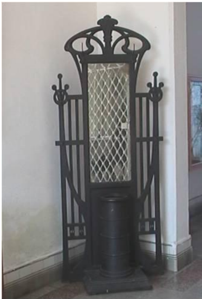
Fig.4. Bastonera-sombrerera de caoba que combina elementos decorativos Art Nouveau y Art Déco. Restaurante 1819. Paseo del Prado, Cienfuegos.

popular y estimado en la Perla del Sur—los negocios con tal éxito y fortuna que muy pronto se transformó su almacén en importador de muebles con venta al por mayor” 14 .