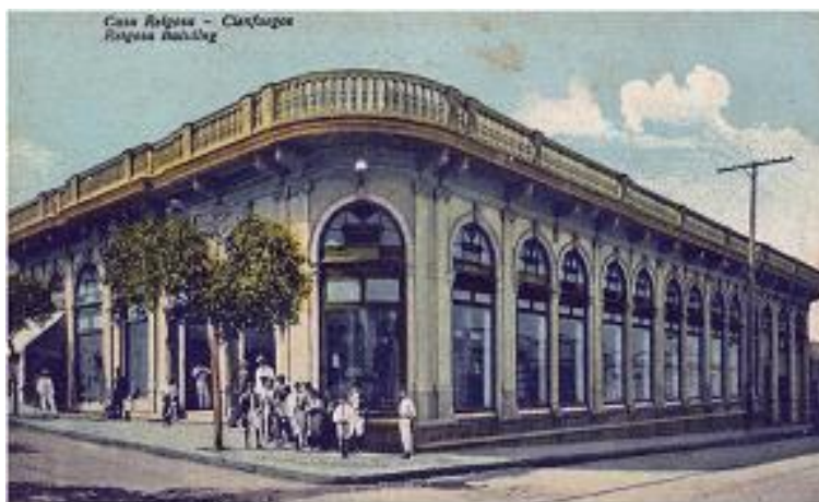
Fig.8. Mueblería Casa Reigosa edificio en 1920. Postal colección privada.