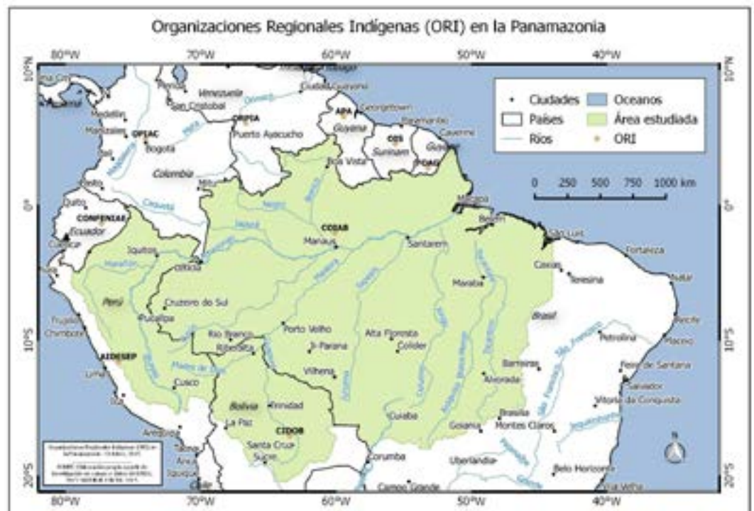
Mapa 1. Organizaciones Regionales Indígenas (ORI) en la Panamazonia