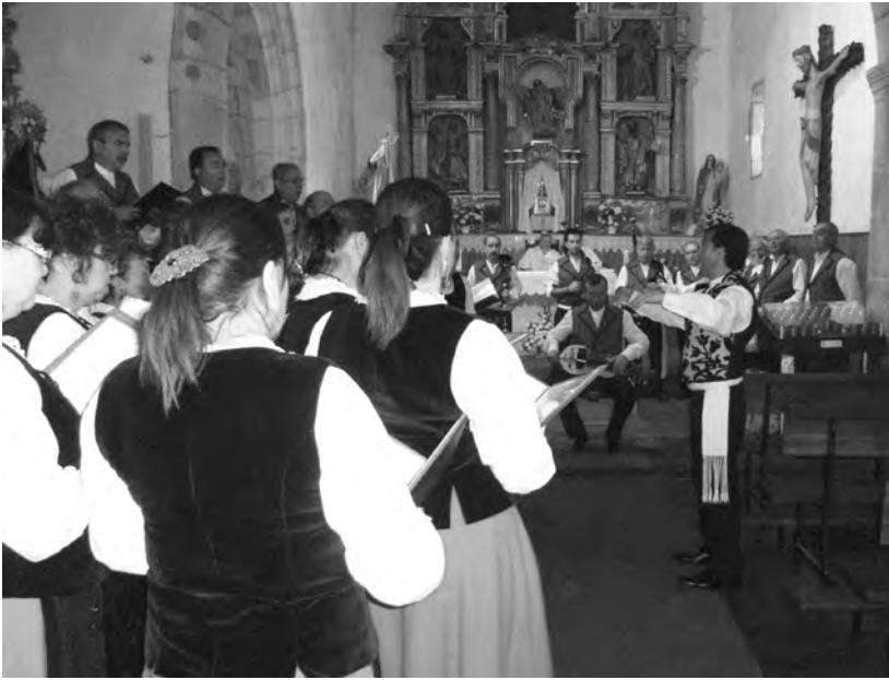
A CORAL DE RUADA ofrecendo un pequeno concerto despois da Misa, na X Romaría Etnográfica Raigame, en 2011. [Arquivo CDR].