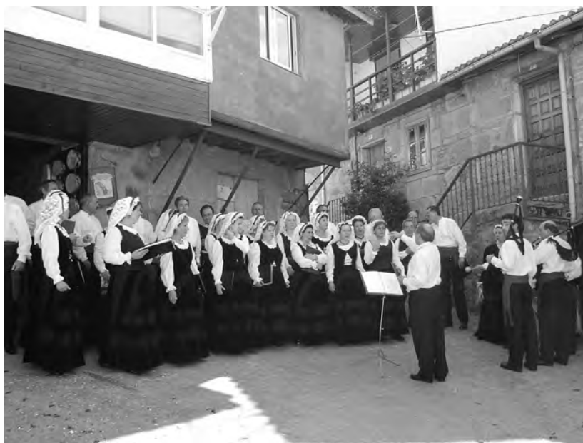
A CORAL DE RUADA na Praza da Rúa do Castelo de Vilanova das Infantes, na III Romaría Etnográfica Raigame, en 2004. [Arquivo CDR].

A organización programou a nosa participación a partir das cinco e media da tarde na Praza Rúa do Castelo. Aquel día de maio presentouse soleado e moi caloroso. Como en Vilanova non hai posibilidade de cambiarse de roupa, tivemos que ir vestidos co traxe da CORAL xa no autobús, que saíu de Ourense arredor das catro da tarde. O vestiario estipulado para aquel día (primeiro erro, seguramente) era o que nós chamamos traxe de gala que, sobre todo no caso das mulleres, resulta pouco apropiado para os días de altas temperaturas. Como consecuencia, tivemos que prescindir dalgunhas prendas e deixalas no autobús. Ao chegar ao lugar asignado, colo-