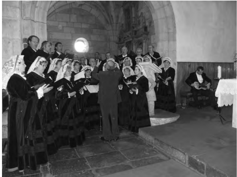
A CORAL DE RUADA cantando o Alalá de Vilanova, con acompañamento de zanfona, na VIII Romaría Etnográfica Raigame, en 2009. [Arquivo CDR].

A Señora do Cristal ten o vestido vermello; éntralle o sol pola porta, relumbra como un espello.