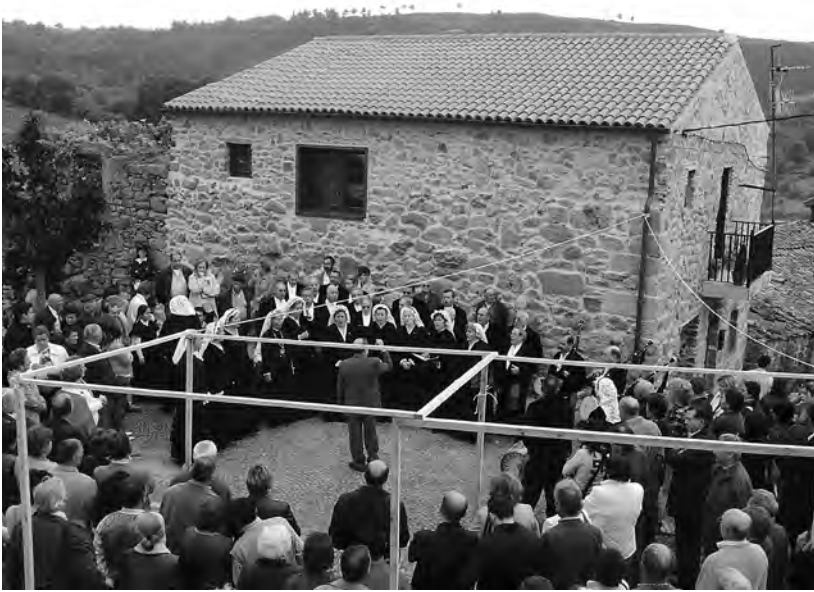
A CORAL DE RUADA ao pé do Castelo de Vilanova das Infantes, na IV Romaría Etnográfica Raigame, en 2005..