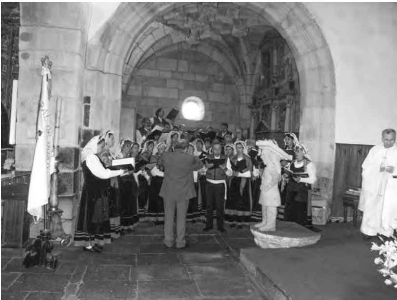
A CORAL DE RUADA cantando a Misa na VII Romaría Etnográfica Raigame, en 2008.

Ante esta situación, o director optou por eliminar a parte polifónica e interpretar unicamente as cantigas populares, con acompañamento instrumental, e rematar canto antes.