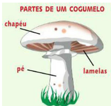
Figura 2. Esquema presente no texto F