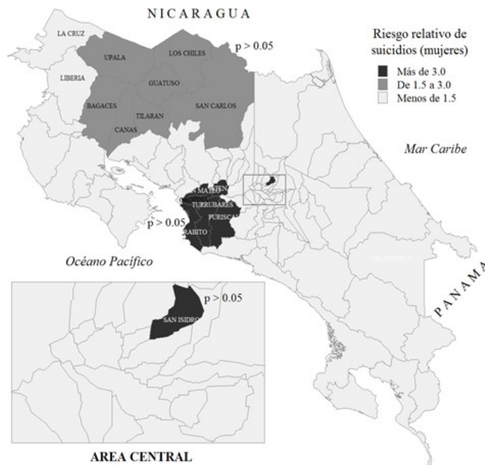
Mapa 3. Conglomerados ( clusters ) espaciales de suicidios en personas de 10-24 años. Costa Rica 2009-2014 (Mujeres).

Fuente: Centro Centroamericano de Población 2014