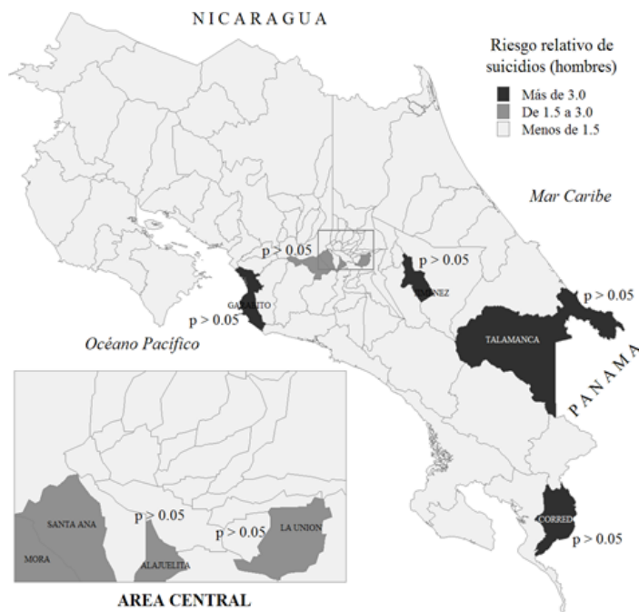
Mapa 2. Conglomerados ( clusters ) espaciales de suicidios en personas de 10-24 años. Costa Rica 2009-2014

Fuente: Centro Centroamericano de Población 2014