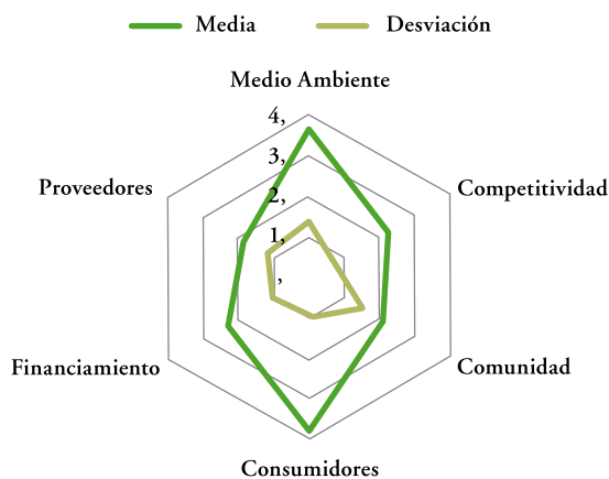
Gráfico 1: Media y desviación según cada indicador de los factores estudiados

calificación de referencia de 2,5, se ubica muy por debajo y desde luego muestra que este no representa un impulsor para el desarrollo de las actividades de RSE en los hoteles estudiados.