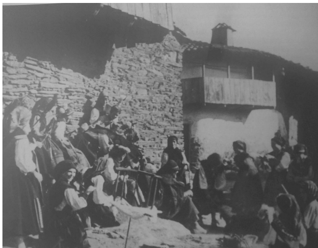
Recreación de un hilandero alistiano en 1927.

En La Carballeda, el serano era una tradición que se mantenía en varios pueblos a mediados de la pasada centuria. En los años cincuenta del pasado siglo se celebraba en las cocinas de Anta de Tera, al calor de la lumbre y a la luz del candil en las largas noches invernales 104 . En Doney se mantuvo hasta los años sesenta, se celebraba cuando se acababa la sementera, predominantemente en los meses de invierno, al anochecer y después de cenar. Las mujeres hilaban y contaban chascarrillos. Los mozos iban donde se reunían las mozas a hacer calceta. Las veladas tenían lugar en domicilios particulares o en el horno del pueblo, que era público. Si un mozo forastero iba a un serano varias veces, las mozas le cobraban el piso 105 .