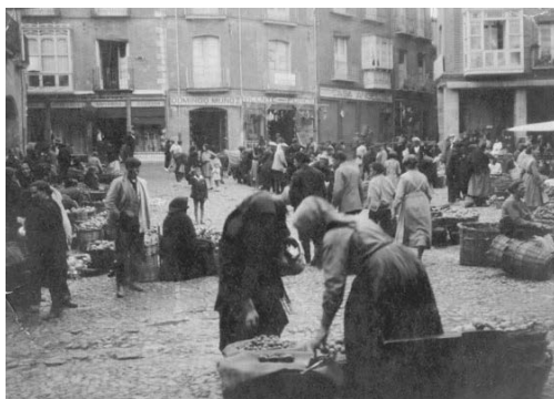
Mercado de Benavente, 1928.

la importancia de la producción linera entre Benavente y las tierras occidentales de la provincia. Pueblos como Bretocino y Brime de Sog sembraban “mucho lino”.