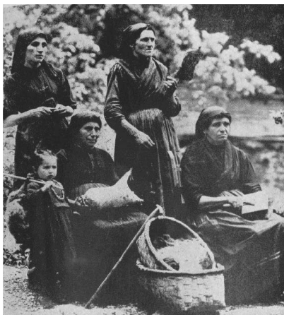
Tejiendo calceta y hilando lana recién cardada (León, ciudad, pueblo y montaña, de F. Álvarez y E. Guerra, México, 195-)

Sin duda, a las fábricas de paños de lana y mantas contribuía la producción local; en 1940, la cabaña lanar provincial era de 623.058 cabezas de ganado. La producción lanera zamorana se consumía principalmente en los mercados de Madrid, Barcelona y Zaragoza; los puntos de aprovisionamiento eran los mercados de Benavente, Sayago y la feria de Botigero en Zamora 58 . Aún así, en determinadas comarcas pervivían las maneras tradicionales: “Hoy todavía queda de aquella manufactura, una curiosa reminiscencia, cultivada en los partidos de Sanabria y Aliste singularmente, que empieza en la manera de cardar la lana, y macerar, mazar y rastrillar el lino, para después pasar aquella y éste por las ruecas de las hilanderas al amor de la lumbre en las largas veladas invernales, y aún en algunos pueblos de Benavente por los hombres, al abrigo de las solanas con el empleo de grandes husos de hierro,