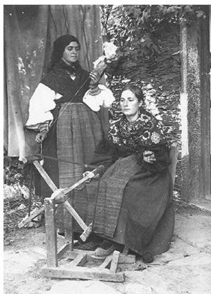
Mujeres hilando. Carbajales de Alba. Hacia 1928-1930.