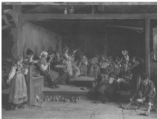
El Filandón, de Luis Álvarez Catalá, 1872.

á la taberna á mojar el lino, como ellos dicen, para que mejor corra el uso; esta costumbre la guardan constantemente las noches de invierno, reuniéndose hombres y mujeres en una casa determinada, donde colocados alrededor de la lumbre, que generalmente es de leña verde, puesta en medio de la cocina sin respiradero para dar salida al humo, pasan el tiempo hilando y cantando hasta las 11 ó las 12 de la noche. Esta reunión es tan grata, que las mozas, cuando alguna de ellas no ha ido, se dicen unas ó otras: ¡oh muliere, anoche no fuiste al filanjeiro! ¡oh muliere, rebeguemos y bailemos!” 61 .