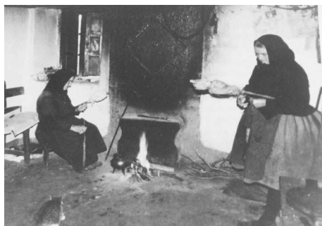
Mujeres hilando ( Paisaje y alma de Aliste , de Gregorio Rodríguez Fernández, 1991).

minando; mientras hervía el pote en el monte de pastoras, camino de la fuente o hablando con la vecina...; pero, era hacia el final de estío cuando daba comienzo la temporada de los seranos o hilandares públicos que durarían hasta abril”... “A la despedida del verano, la bonanza del tiempo permitía que estas reuniones fuesen al aire libre, encendiendo fogata si refrescaba la noche. Más, con los barruntos invernales se trasladaban bajo techo, por cuadras y cocinas espaciosas” 39 .