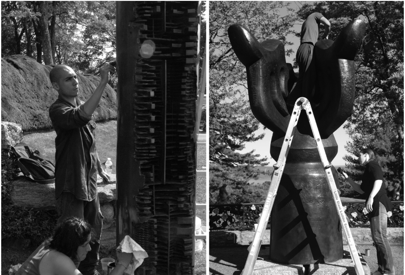
FIGURA 2. Izquierda, estudiantes de la ENCRyM-INAH interviniendo una obra de Pomodoro; derecha, estudiantes de la ENCRyM-INAH y la ECRO aplicando cera en The song of the vowel del escultor cubano Jacques Lipchitz (Fuente: Ugarte 2010 y Romero 2011).

El programa ha ido incorporado otras actividades, entre las que destacan los recorridos por la propio Kykuit Rockefeller Estate, las visitas para conocer las obras y planes de conservación de la colección escultórica de PepsiCo (Pepsico Sculpture Gardens o Donald M. Kendall Sculpture Gardens) y los laboratorios de conservación de prestigeadas instituciones culturales, como el Museum of Modern Art (MOMA, Museo de Arte Moderno), el Metropolitan Museum of Art (MET, Museo Metropolitano de Arte), la Morgan Library and Museum (MLM, Biblioteca y Museo Morgan) y el Textile Conservation Workshop (TCW,